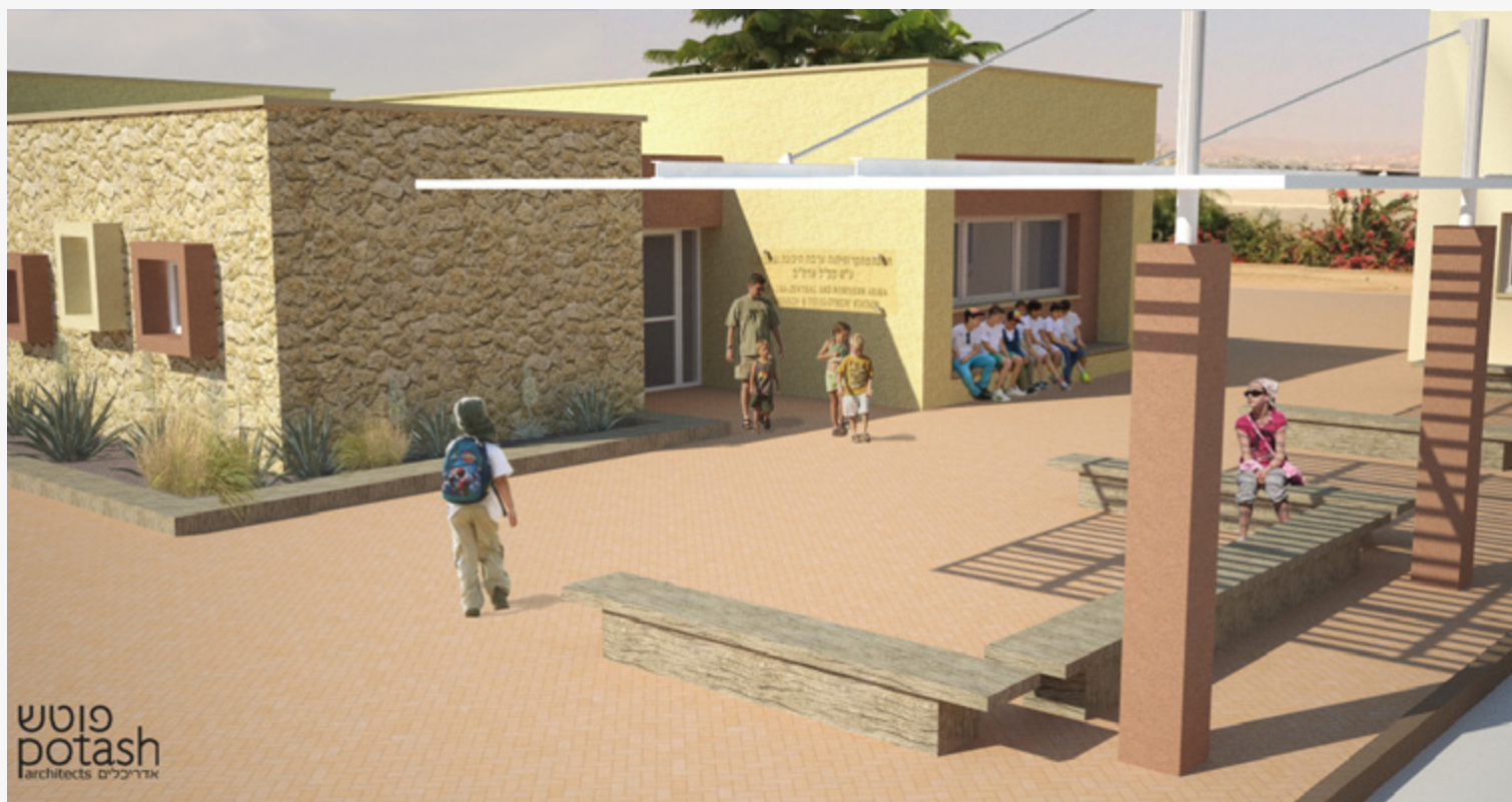
הדמייה של מבנה מרכז מדע לילדים במו"פ. מרכז המדע לילדים ייתן מענה איכותי, נעים ומקצועי ללימודי המדעים במסגרת חממת הערבה הפועלת במו"פ.