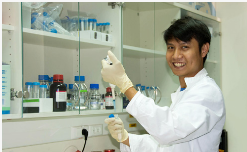
סטודנט לתואר שני במעבדה במו"פ במסגרת תוכנית הלימודים המשותפת של מרכז המשתלמים בערבה עם אוניברסיטת תל אביב.

נפתח בשנת 2014 לקהל הרחב בהצלחה גדולה. המרכז מהווה עוגן חשוב לחשיפת הערבה ומסייע בשיווק ובחשיפה של עסקי התיירות והאטרקציות בערבה. כחלק מפעילות המרכז ושיתופי הפעולה עם העסקים והיזמים בערבה, במרכז נמכרת