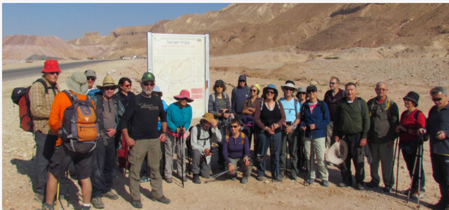
טיול של משתתפי קתדרה לוותיקי הערבה

לאוכלוסיית המבוגרים במועצה. • תכנית שנתית של פעילות חברתית-תרבותית אזורית קבועה לגיל השלישי במתנ"ס הכוללת מפגשי חברה, חוגים, הרצאות, סדרות העשרה ודעת, יצירה ואמנות, טיולים ספורים ופעילויות מגוונות. • הפעלת תכנית קהילה תומכת לגיל השלישי-תמיכה וסיוע באופן אישי לתושבים הוותיקים ביישובים. • גיוס משאבים ואפיקי תמיכה לקיום תכנית פעילות חברתית לגיל השלישי בערבה. • פעילות התנדבותית ייעודית לגיל השלישי המאפשרת קשר ומפגש בין-דורי. • הקצאת שטח ותכנון ראשוני להקמת מרכז אזורי לגיל השלישי. • הפעלת קבוצות תמיכה לבני משפחה המטפלים בקרובים סיעודיים ודמנטיים. • הנגשת אולם רוזנטל לכבדי שמיעה.