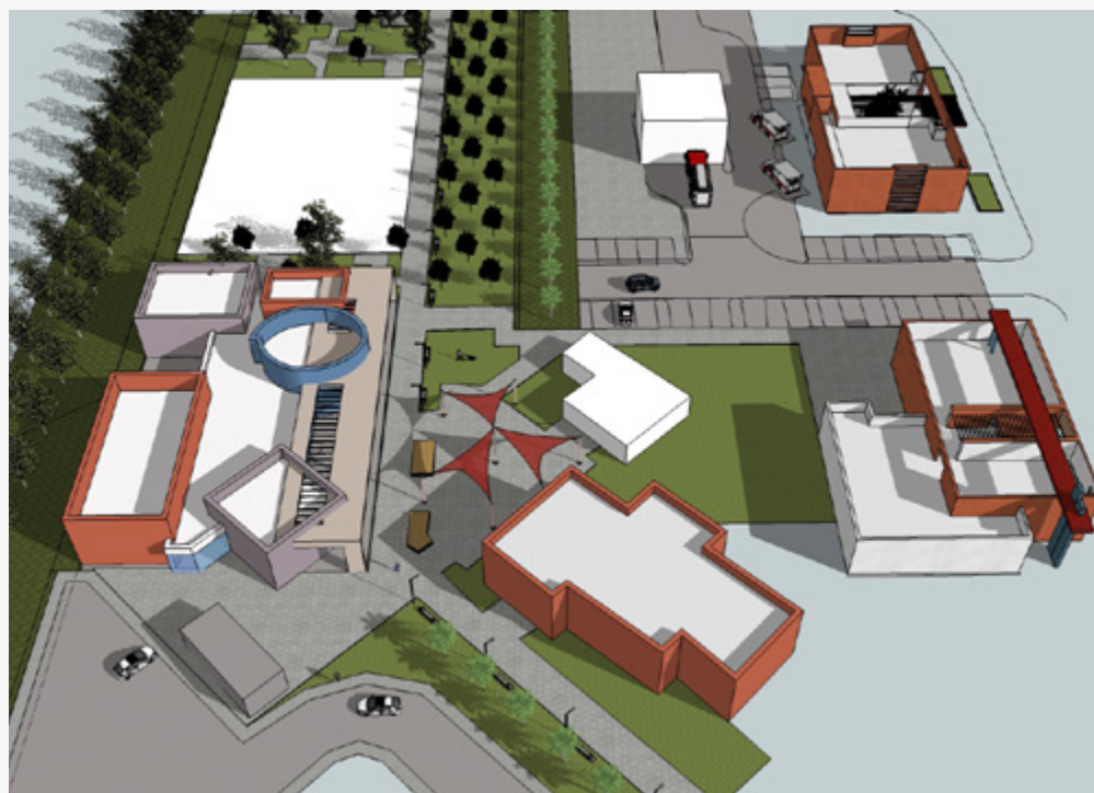
פריסה של שלושה פרויקטים: מרכז רפאה אזורי (קיים), מרכז חילוץ והצלה אזורי וקמפוס חדש למרכז המשתלמים (ההקמה צפויה בחודשים הקרובים).