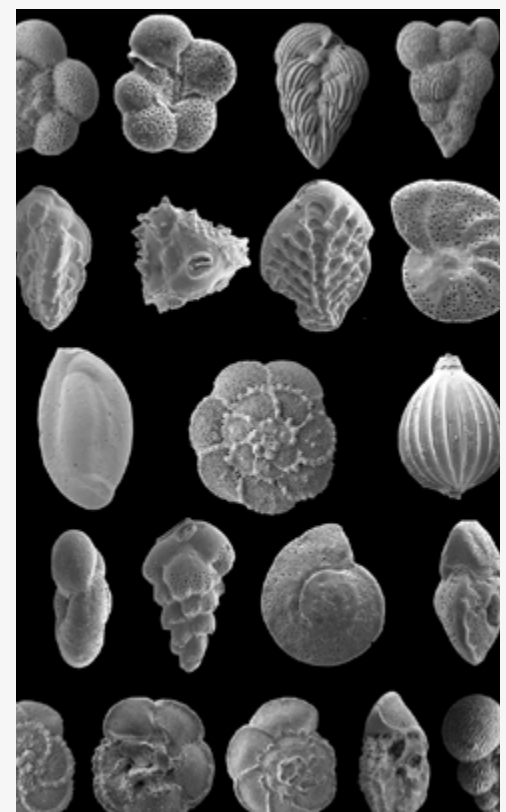
מאובנים של יצורים חד תאיים בעלי שלד חיצוני גירני