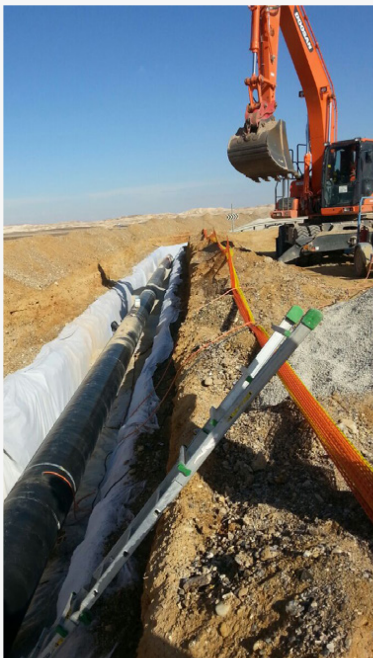
נחתת קווי מים שפירים מהערבה הדרומית לערבה התיכונה. חיבור מלא של הערבה למים שפירים מצפון יסתיים במהלך שנת 2017 ומדרום בעוד חמש שנים.

נוסף על כך, נמשכות עבודות להפעלתם של קידוחים נוספים באזור חצבה, עין יהב ופארן.