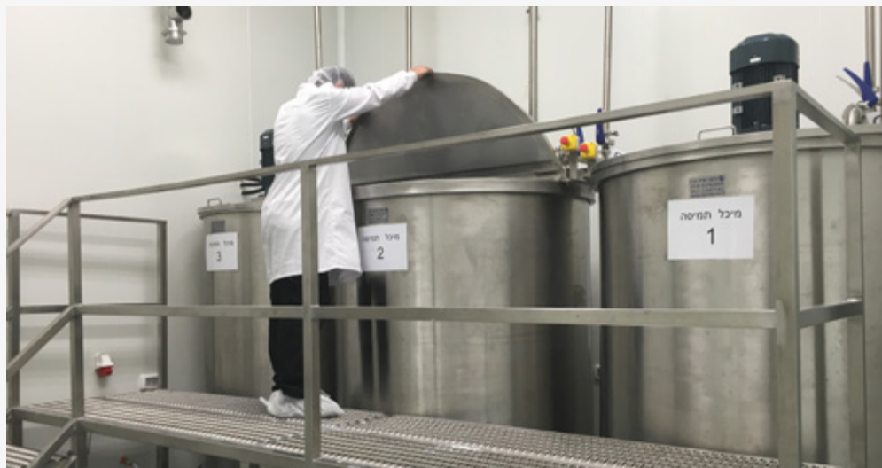
מפעל אמורפיקל שהוקם לאחרונה באזור התעשייה ספיר צפוי להעסיק מעל למאה עובדים.

בועז עוז מחצבה, בת שבע אזולאי מעידן, דני שניטמן מספיר, צפריר אורטס מצוקים, פנינה דואק מצופר, עדי מטמון מעין יהב ונציגים נוספים. מפגשי תירנים מתקיימים ארבע פעמים בשנה. אלו מפגשים המקדמים שיתופי פעולה, וכוללים מפגשי הכשרה בתחומי הרשתות החברתיות, הפרסום והנגישות. המחלקה מטפלת גם בכפר האומנים בצוקים. בכפר פועלים כעשרים וחמישה אומנים ויוצרים תושבי צוקים השוכרים חדרי סטודיו במתחם. בימי שישי מתקיים יריד מכירות בשעות הבוקר והצהריים וכן מתקיימת פעילות מיוחדת לחגים ואירועים. בחופשת הקיץ הפעילות מתרחבת וכוללת את ערבי חמישי במטרה להגדיל את היצע התיירות והאטרקציות למתארחים באזור.