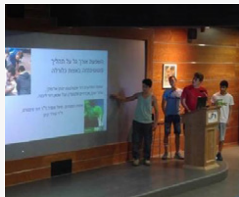
ציגת עבודות חקר שכבת ט'

נפתחה מגמת לימוד בהיקף של 5 יחידות לימוד המאפשרת לבנות המחול המשקיעות זמן וכוחות בריקוד, לקבל הכרה על עשייתן גם במסגרת לימודיהן בתיכון. נפתח מסלול פנאי של ברייקדאנס והיפ הופ. תלמידי המחול הוזמנו להופיע בפסטיבל במלטה, ובאירועים ארציים אחרים.