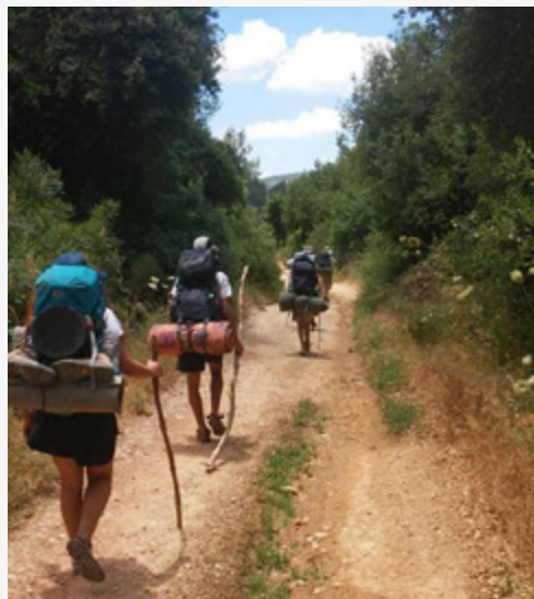
תכנית מל"א