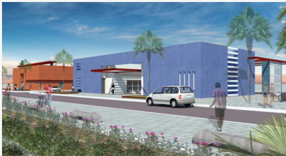
הקמת מרכז חילוץ והצלה שיכלול את כל שרותי החירום האזוריים - מד"א, כיבוי אש, משטרה, יחידת חילוץ ומוקד חירום אזורי, בצמוד למרכז הרפואי האזורי, תחל בחודשים הקרובים.