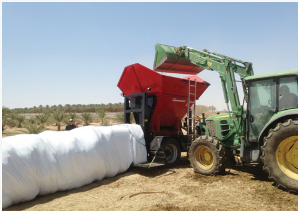
פרויקט לטיפול בשאריות גידול כפתרון קצה המספק תערובות מזון לבעלי חיים וקומפוסט לשימוש חקלאי.

המתפתח והמפותח. המו"פ בוחן מספר אפשרויות של מכירת חבילות ידע והבאתן של משלחות להשתלמויות בחקלאות בערבה. התנאי הראשון להעברת הידע הוא שהעברת הידע לא תשמש לתחרות נגדנו בשווקים שאנחנו נמצאים.