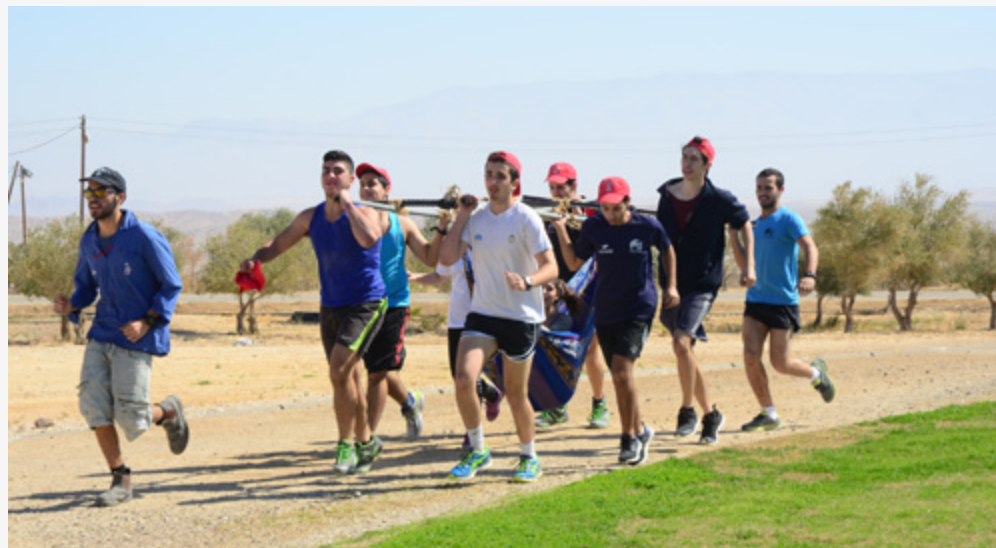
יום צה"ל