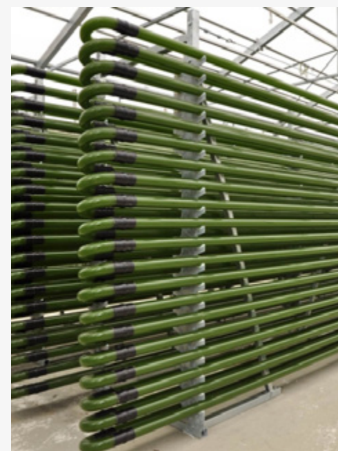
גידול אצות

פרויקט נוסף עוסק בבחינת הגידול של דג הנוי היקר בעולם - ארואנה. בתחום דגי הנוי במימון קרן יק"א ובשיתוף מכון וולקני מתקיים פרויקט ליצירת אוכלוסייה כל זכרית