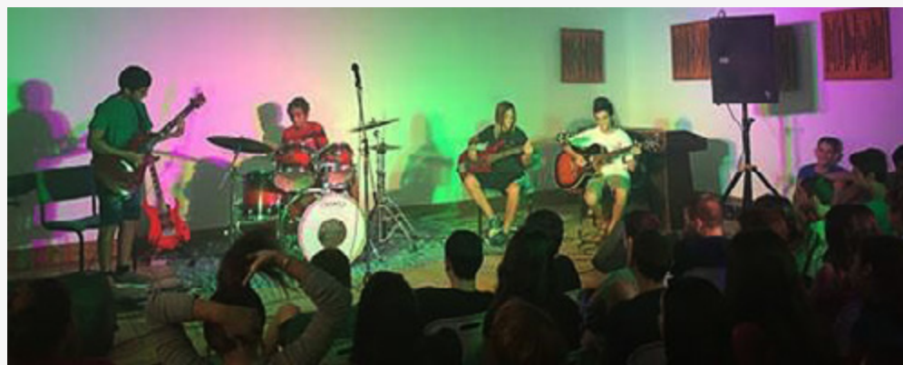
הכיתה החדשה של תכנית "תיבת נגינה"