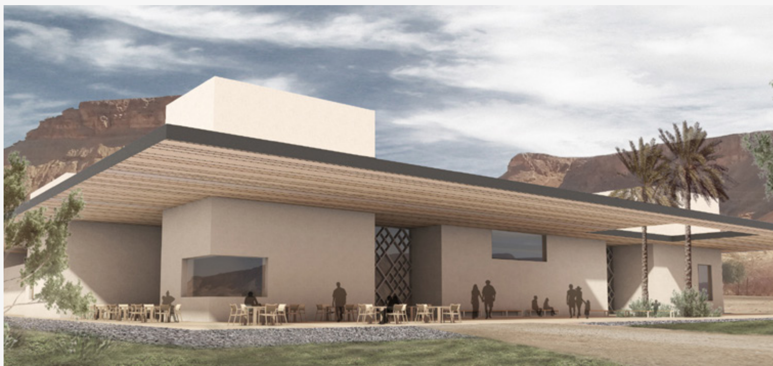
הדמייה של בריכה ומרכז ספורט אזורי שבנייתם צפויה להתחיל בספיר בחודשים הקרובים.