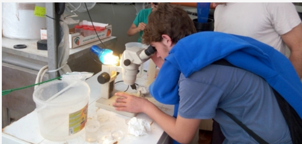
מחקר הזנה בדגים, חממת הערבה