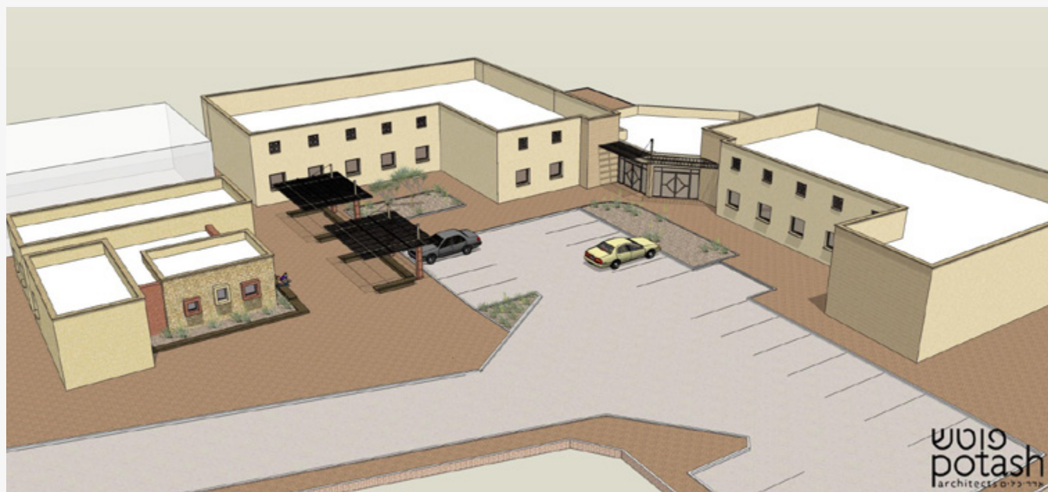
הדמייה של אגף מעבדות חדש במו"פ אשר ישלים את מבנה המעבדות הקיים ויאפשר קליטה של חוקרים נוספים וכניסה לתחומי מחקר חדשים.