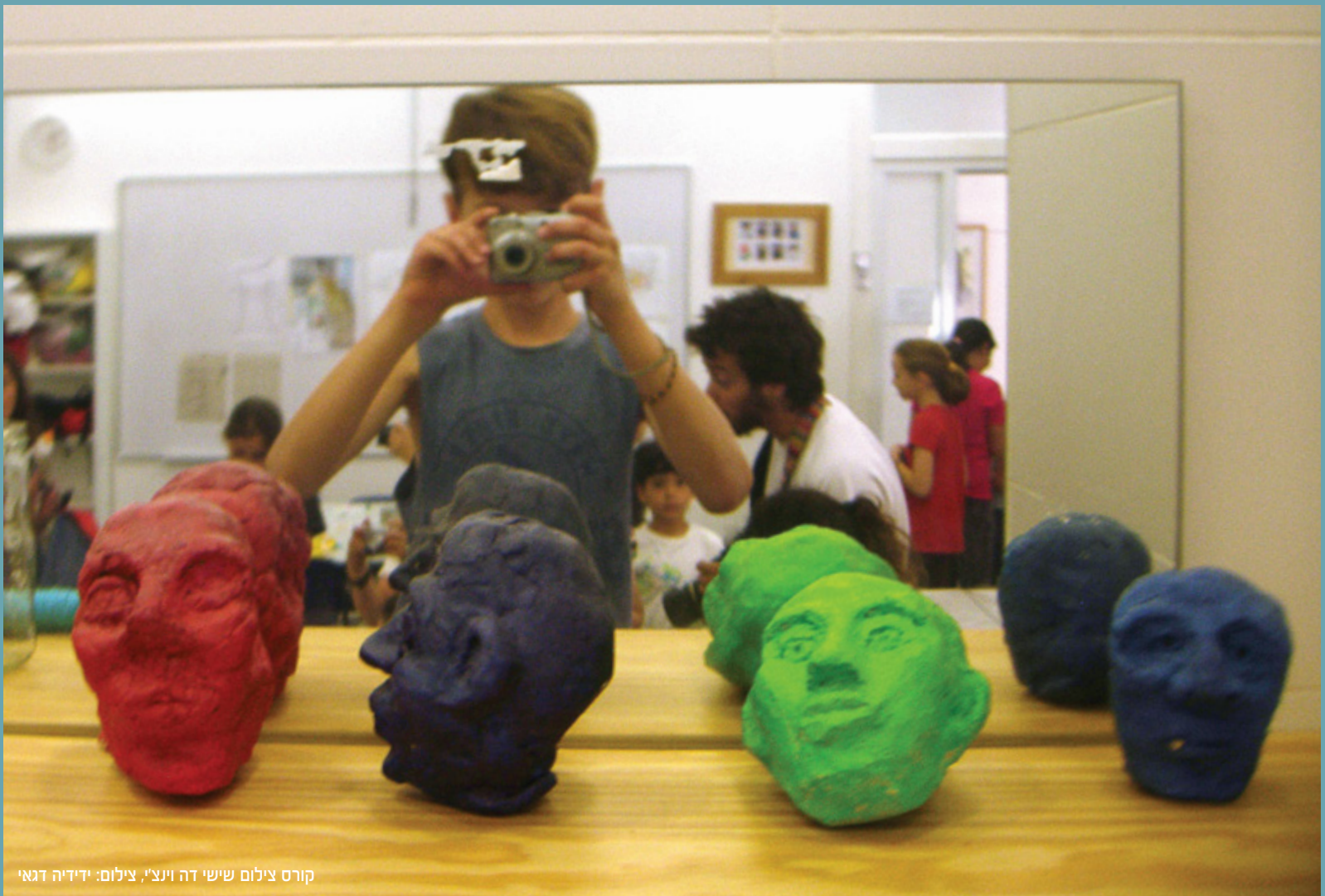
קורס צילום שישי דה וינצ'י

אילת להב ביגר, מנהלת מח' חינוך ומתנ"ס ערבה הנהלה וצוות המתנ"ס