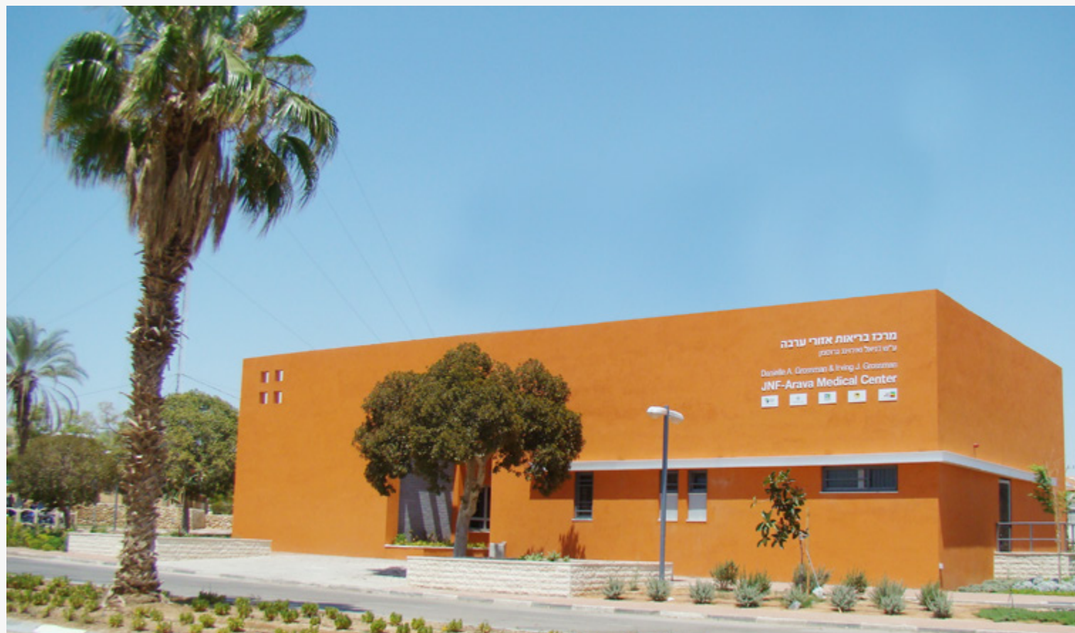
מרכז רפואי אזורי נפתח לפני שנתיים והוא כולל חדרי טיפול, מרפאת ילדים, שירותי רפואה מתקדמים ואת מוקד הרפואה הדחופה הפועל 24 שעות ביממה 7 ימים בשבוע.