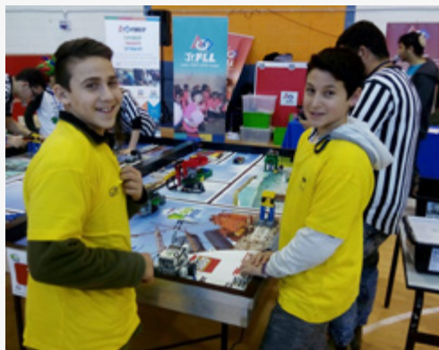
תחרות רובוטיקה מחוזית

מחלקת החינוך והמתנ"ס מנוהלים כיחידה אחת זה שלוש שנים ומהווים ציר מרכזי מגובש לקידום פעולות החינוך הפורמלי והבלתי פורמלי.