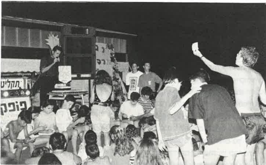
בריכת ספיר ביום הילד

בתאריך 29.6.91 התקיים "יום הילד" במרכז ספיר, כהמשכה של מסורת בשנים האחרונות. יחדו של יום הילד הינו במעורבות הנוער הבוגר של היישוב, במסגרת מועצת הנוער, ועדת תרבות ומדצ"ים. יום הילד התקיים בבריכה של ספיר. בחלק ה-I נערכו משחקי מים לכל המשפחה, פינות יצירה עשירות, והופעות של ילדי הישוב אשר קצרו תשואות חמות ואוהבות.