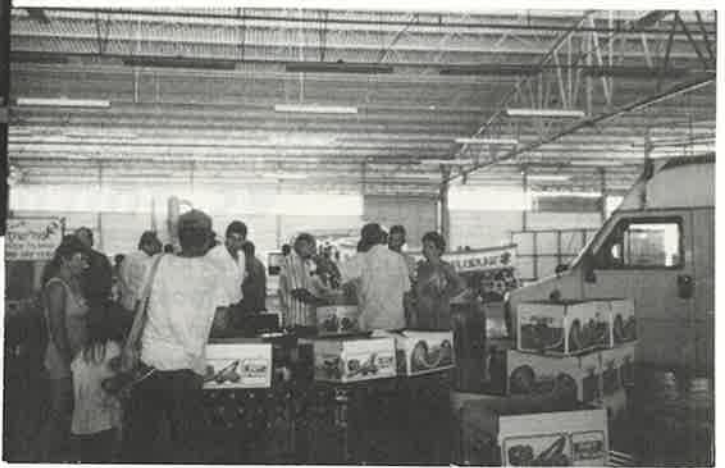
מכונת האריזה בהדגמה