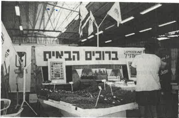
תצוגת שתילים בתערוכה