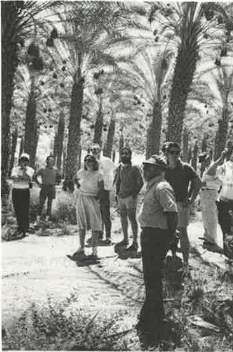
מטע התמרים בעין-יהב