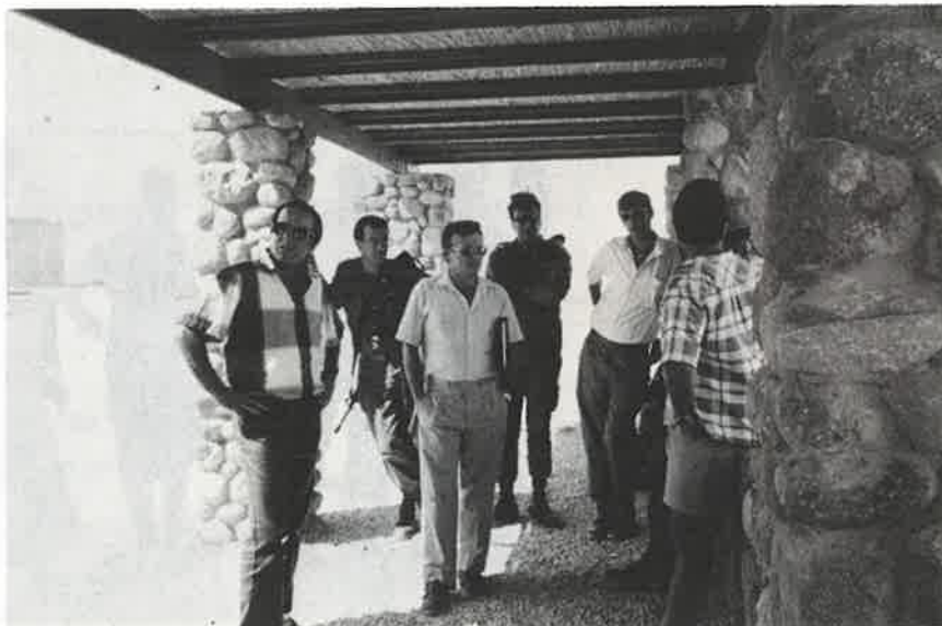
עוזר שר הבטחון בתצפית שיוף