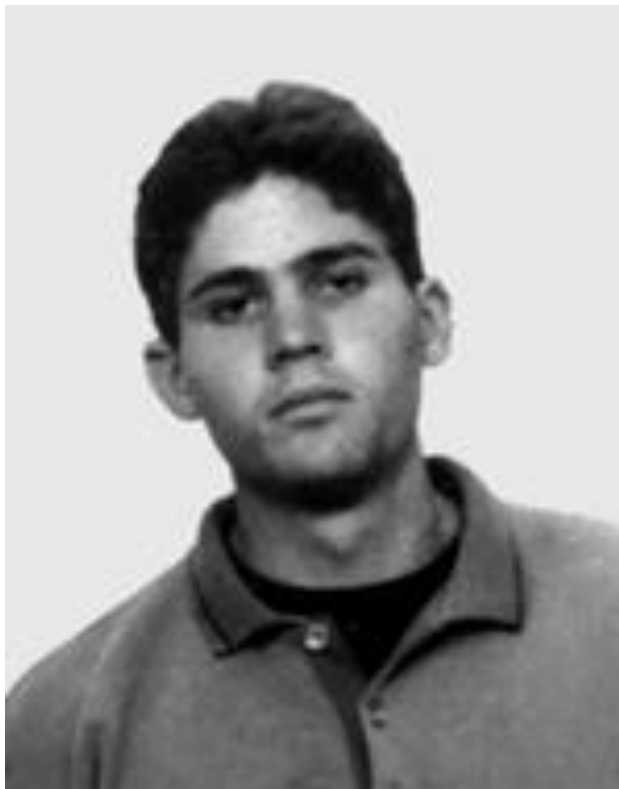
סמל ארי פרלמוטר

בן חצבה. ניב נולד ב- 29.6.1973, נפל בלבנון 25.10.1992. ניב נקבר בבית העלמין בחצבה. לסיפור חייו באתר "יזכור" <