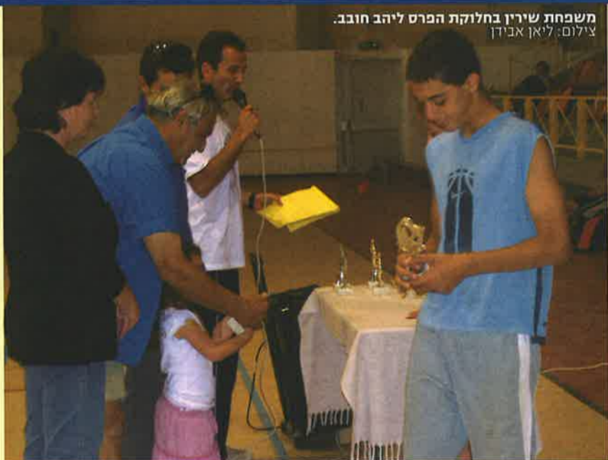
משפחת שירין בחלוקת הפרס ליהב חובב.