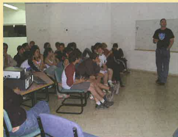
"יום בטוח" באינטרנט התקיים ב-4.4.05 בו השתתפו 20 מבוטרים ותלמידי כיתות ה'-ז'. היום הונחה ע"י צוות ממיקרוסופט ובו נלמדו סכנות האינטרנט ודרכי שמירה כגון: אבטחת מידע, וירוסים, מתברר שבכל כיתה אחוז הגולשים באינטרנט הוא גבוה ביותר.