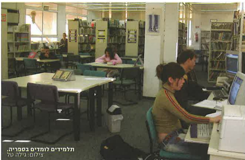
תלמידים לומדים בספרייה.

הספרייה האזורית מתעדכנת ומתחדשת ומציגה שלל יכולות חדשות