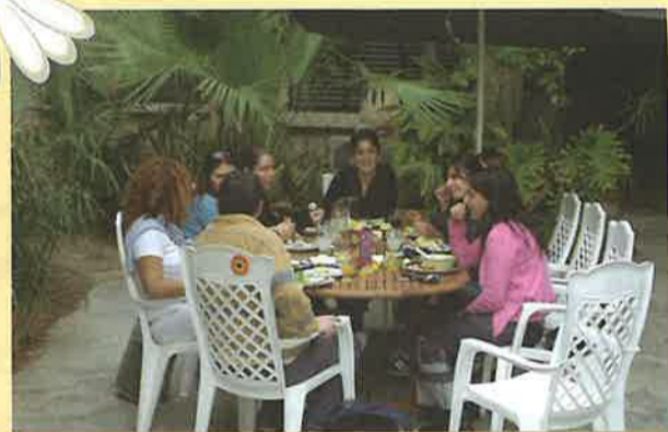
ביקור עובדי חברת סלקום באזור הערבה 7.3.05 - עובדי חברת סלקום נדדו ממשכנם המפואר בהרצליה והגיעו ליום שכולו כיף בערבה. את היום ארגנה מחלקת סולר בחברה לפיתוח.