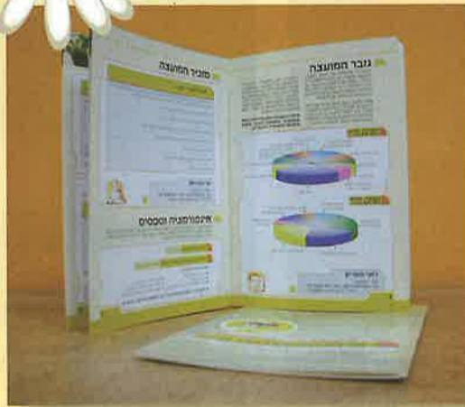
חברת סל שירותים לתושב חולקה לתושבים בחודש פברואר ומפרטת בצורה ברורה את השירותים אותן מקבלים תושבי הערבה. ניתן לקבל את החוברת במשרדי המועצה. טל': 08-6592207.