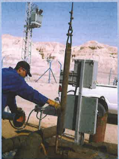
נקיון קידוח חצבה.

החלוקה הפנימית: לחקלאות, ליזמות ולצרכים אחרים, לרבות צרכי ציבור, גידולים משותפים וכו'. לפיכך - אחריות הצרכן היא לעמוד בתנאי הקצבות המים ברשיון המסופק ע"י נציבות המים מדי שנה, ולהקציב לכל תחום פעילות את ההקצבה המאפשרת עמידה במגבלה זו. 2. מגבלה נוספת הינה מגבלת הקידוחים ויכולת העברת המים מהקידוח/בריכה ליישוב ולצרכן. קיימת הגבלה בכמות המים אותם ניתן לשאוב בזמן נתון, קיימת מגבלה לאיגום אופרטיבי של המים, וכן מתרחשים שינויים ותקלות במערכת המים באופן טבעי מעת לעת. לפיכך קיימת מגבלת אספקה לשעה/יממה