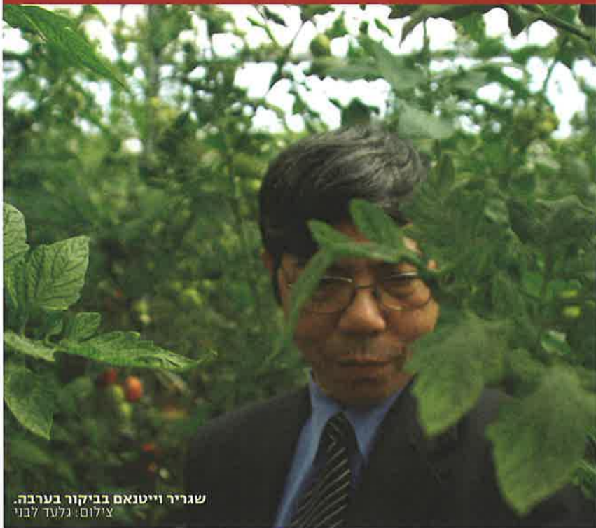
שגריר וייטנאם בביקור בערבה.