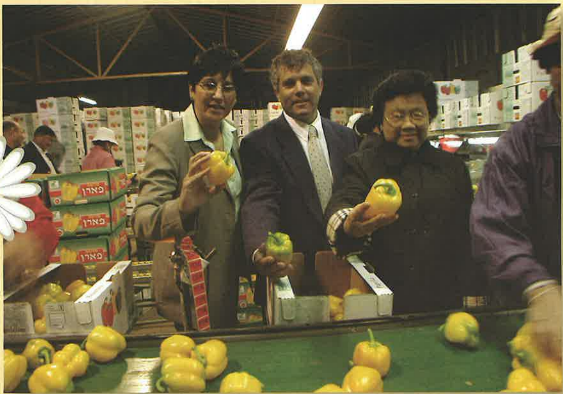
שרת העבודה התאילנדית, גב' אורייואן טינג-טונג, הגיעה לראשונה לישראל לבחון מקרוב את תנאי העסקתם ומידת שביעות רצונם של מאות העובדים התאילנדים המועסקים כיום בערבה. ביקורה התקיים ב-17.12.04.