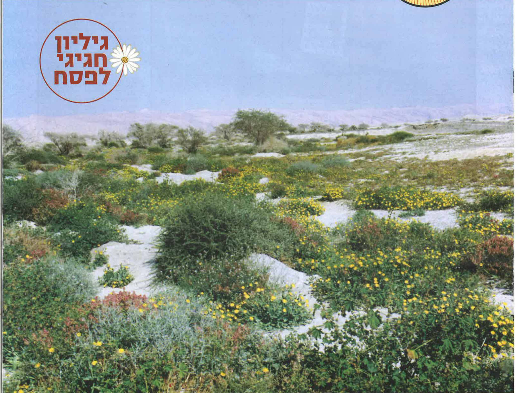
פריחה בנחל חצבה.