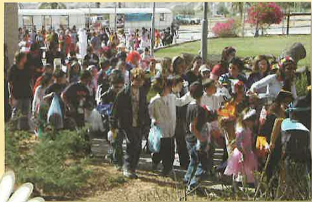
מורים בבתי הספר בספיר 23.3.05.