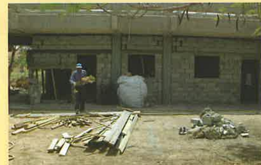
שיפוץ מבנה הדואר של הישוב ספיר ומחלקת התפעול במועצה.