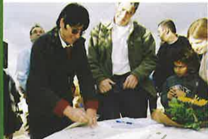
סקס הכרזת צוקים.