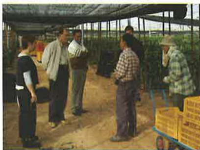
מנכ"ל משרד התיירות מיאנמר בביקור בערבה.