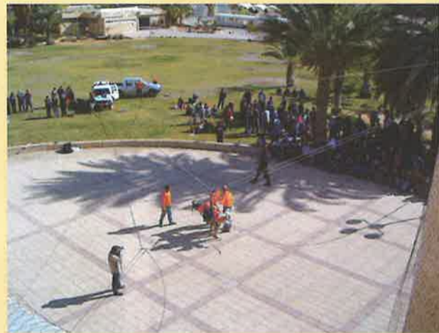
תרגיל יחידת חילוץ 3.1.05 בשיתוף בי"ס תיכון.