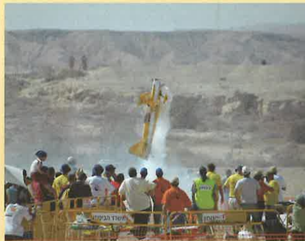
מפגן הערבה הפתוחה התקיים בתאריך 26.2.05 זו הפעם החמישית ברציפות בהשתתפות בכירי הטיסאים מהארץ ומחו"ל ובנוכחות 7000 צופים.

מדריך הטורמיסט (לא לגלקסיה - לערבה) מחפשים טרמפ לבאר שבע? לאילת? לתל-אביב? עד היום ביליתם שעות בניסיון נואש לטרמפ? לאינטרנט ערבה כותרון מושלם עבורכם בחודש האחרון הושק מדור חדש בלוח המודעות באינטרנט ערבה הנקרא "טרמפ". המדור פתוח לנוחות כל המבקשים למצוא טרמפ למחוז הפצם ומנגד - לנהגים המעדיפים להעביר את זמן הנסיעה הארוך בחברותא. המודעה הראשונה התפרסמה באמצע חודש מרץ 2005, ומאז המדור תופס תאוצה והפך להיות הדינמי והמבוקש בלוח המודעות. כיום, זמן קצר לאחר השקתו מהווה מדור "טרמפ" את הערוץ המרכזי לתקשורת בנושא נסיעות מחוץ לערבה. בהזדמנות זו נודה לגילה טל, מנהלת אינטרנט ערבה ולשגי אסף מעין-יהב האחראית על לוח המודעות. לפרסום בלוח המודעות: www.arava.co.il/board2