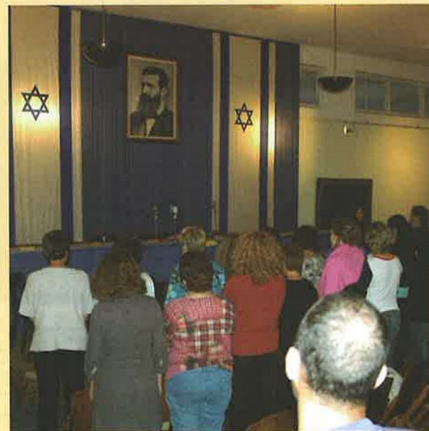
סיור עובדי המועצה ושלוחותיה התקיים ב-31.3.05 במהלכו ביקרו במחיאון העצמאות ברח' רוטשילד בת"א. עובדי המועצה עומדים בשירת התקווה.