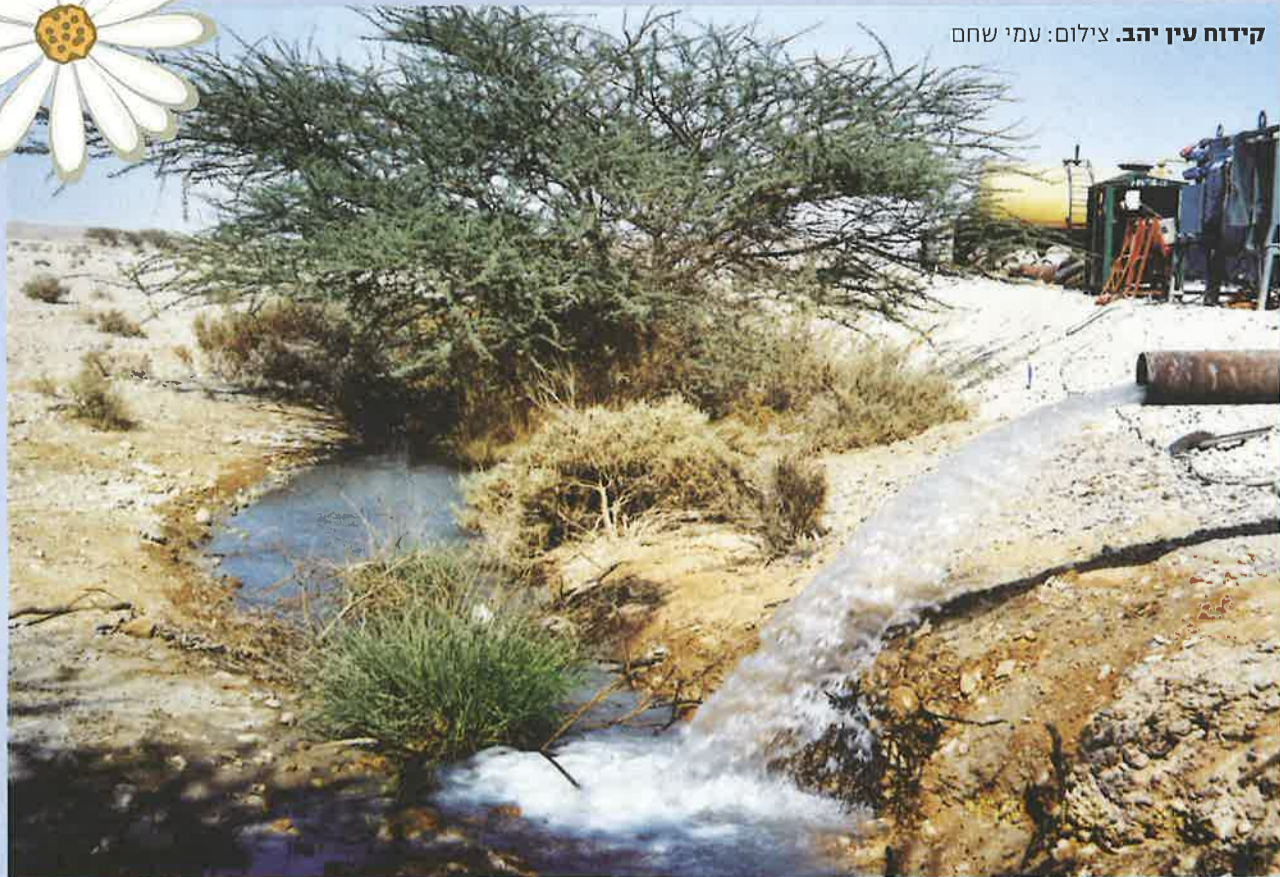
קידוח עין יהב.