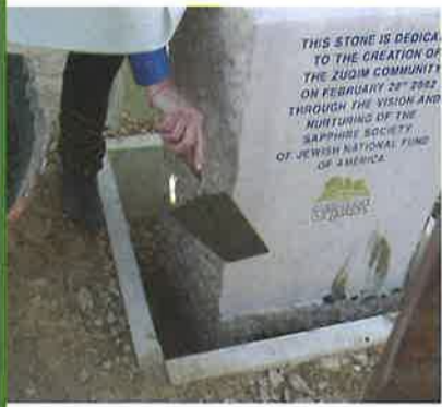
הנחת אבן פינה צוקים.

שנה בלבד לאחר שהוכרז הישוב צוקים כיישוב קבע, הסתיים שלב א' ושווקו כל 50 המגרשים הראשונים המיועדים לבנייה בשיטת "בנה ביתך"