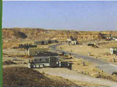
צוקים היום.

נשקף נוף בראשיתי מרהיב הצופה על רמות צופר.