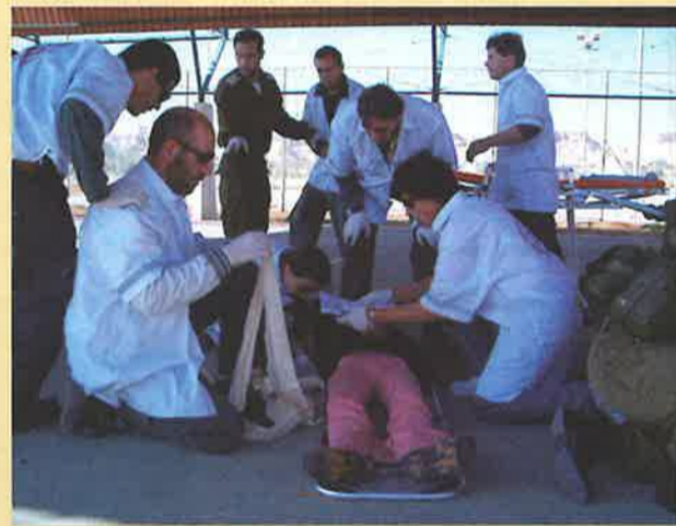
תרגיל אירוע רב נמגעים 10.1.05 בשיתוף כוחות מד"א, צוות רפואי בערבה וחטיבה 406.

אינטרנט מהיר - במהלך החודשים מאי ויוני יעבור מנויי אינטרנט ערבה המחבורים לכבלים לשימוש ב-ADSL. זוהי מערכת אינטרנט מהיר דרך קו הטלפון, ויתרונותיה בהיותה זולה ונוחה להפעלה. אנו צופים פחות תקלות בתפעול המערכת.