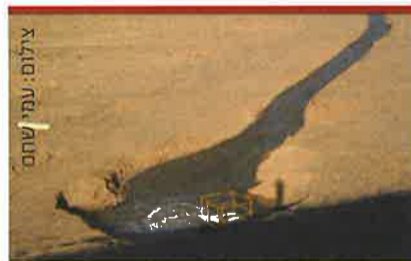
העברת מים ממאגר חצבה למאגר עידן

בתהליך זה אנו ממפים ראשית את מערך השירותים, מזהים את היתרונות והחסרונות של הגופים השונים המספקים את השירות ובסוף נחליט יחד עם היישר בים על מתווה הפעילות הרצוי לעתיד ועל התפקיד שימלא כל אחד מהמעורבים.