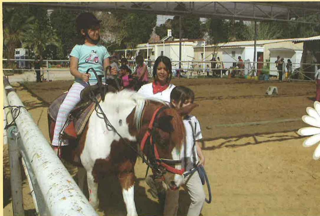
אירוע סוסים התקיים במסגרת אירועי מתנ"ס בעין-יהב 2.4.05 - הפנינג משפחות מהנה אצל משפחת אסא בעין-יהב.