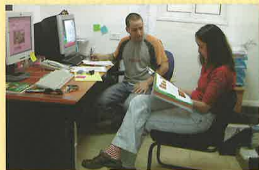
מחלקת הגרפיקה בחברה לפיתוח מתרחבת, וכיום עובדים במחלקה 2 גרפיקאים תושבי עין-יהב. עבודות גרפיקה מוצעות לתושבי הערבה באיכות גבוהה ובמחירים תחרותיים, מתחת לחלון ועד פתח הבית.