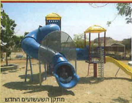
מתקן השעשועים החדש