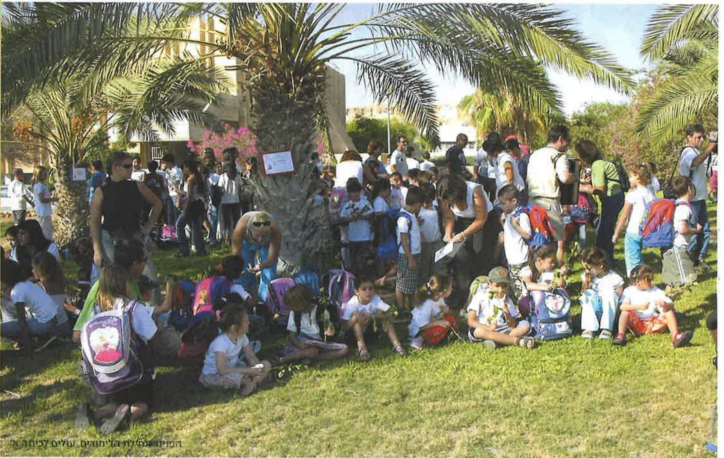
המיוג נעשה על ידי מדריכים נעלים לכיתה א'