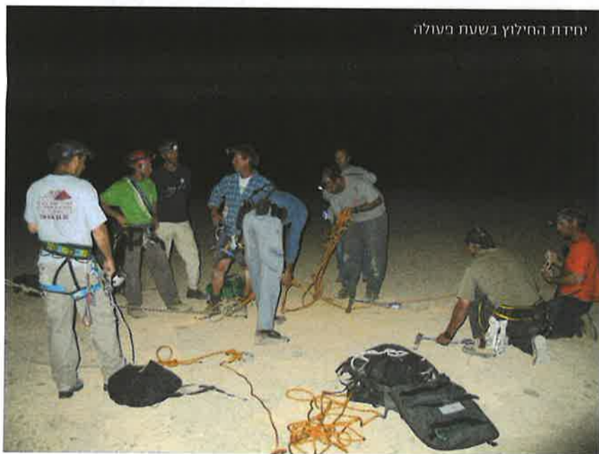
יחידת החילוץ בשנת פעולה

היחידה גם פועלת במסגרת תפקידה באמצעים המשוכללים והאיכותיים ביותר הקיימים כיום. כך למשל את מקומם של הביפרים בהם השתמשו חברה בעבר תפסו לא מכבר הודעות ה-SMS המועברות במקרי חירום למכשירים הסלולאריים של כל חברי היחידה. כשמגיעה הודעה כזו יוצאים כל חברי היחידה למקום האירוע, ועל פי הצורך וגודל האירוע מוחלט האם