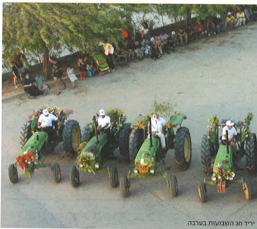
יריד חג השבועות בערבה