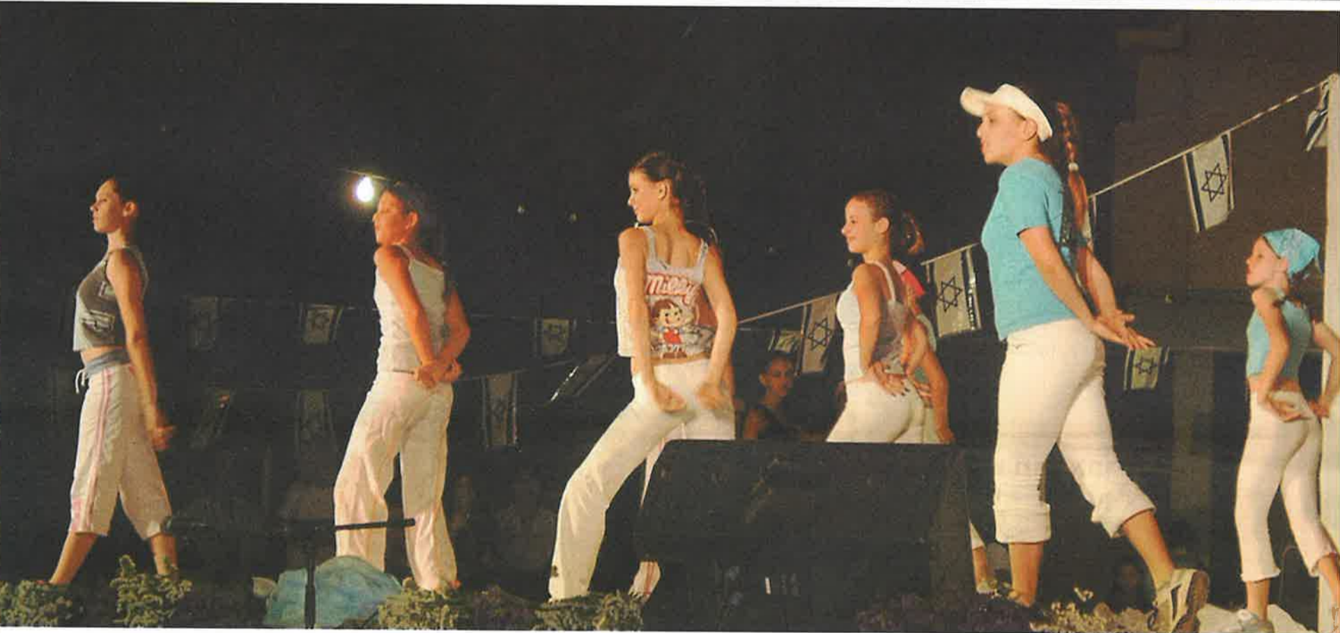
חגיגת יום העצמאות המרכזית בפארק ספיר