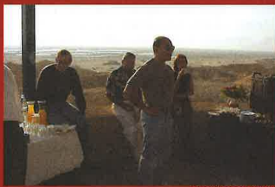
רגעים בדרך הארוכה