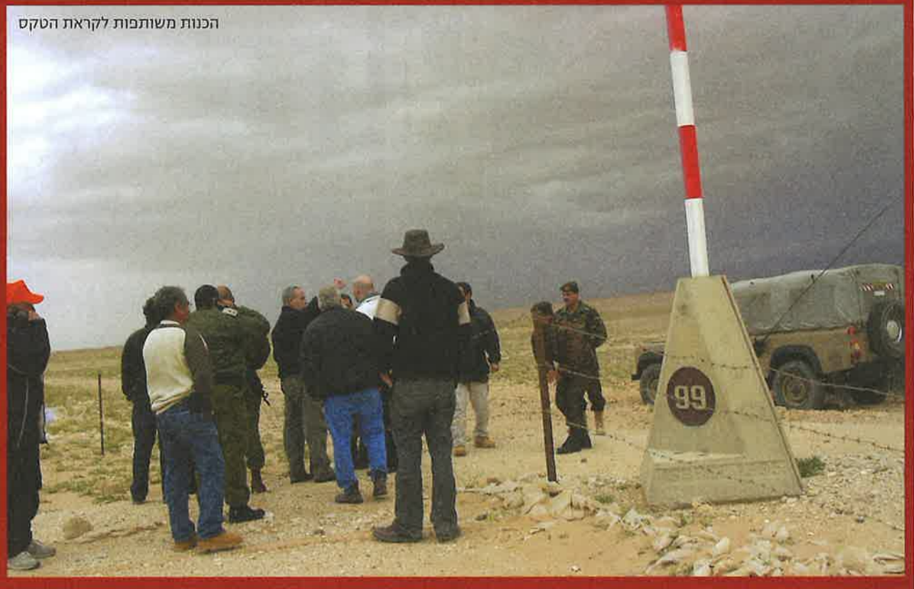
הכנות משותפות לקראת הטקס