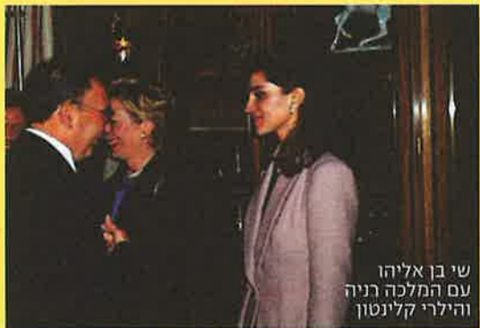
שי בן אליהו עם המלכה רניה והילרי קלינטון