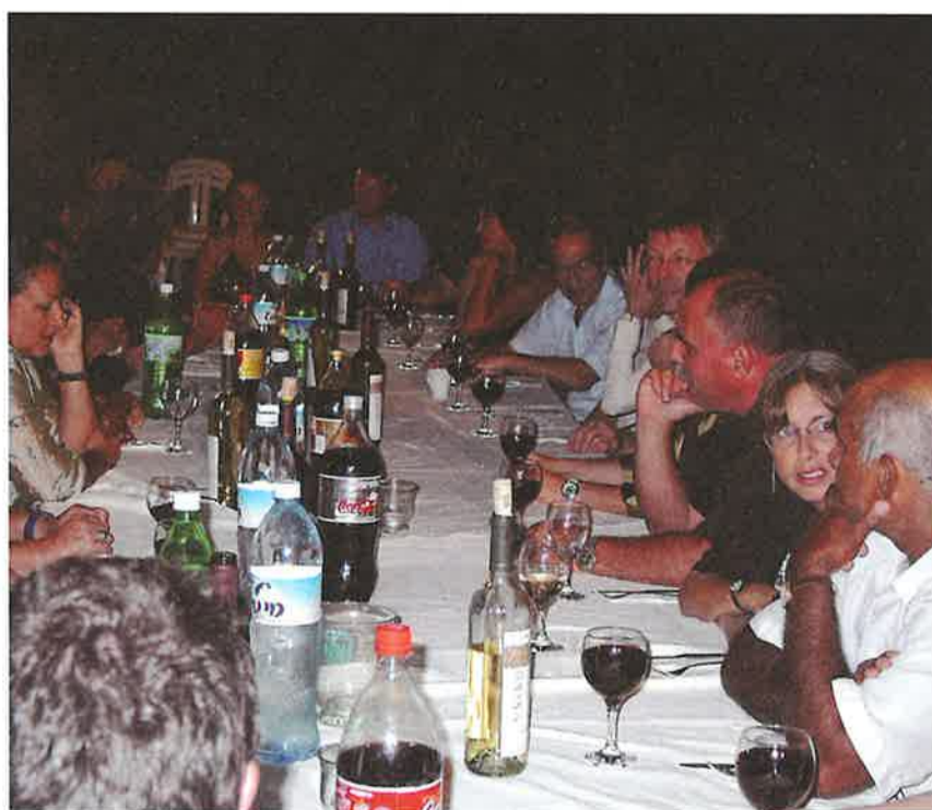
ערב הוקרה לפסל אנדרו רוג'רס. בין פסליו - פסל הח"י שליד מרכז ספיר. הערב נערך בחסות הסוכנות היהודית - פרויקט שותפות 2000