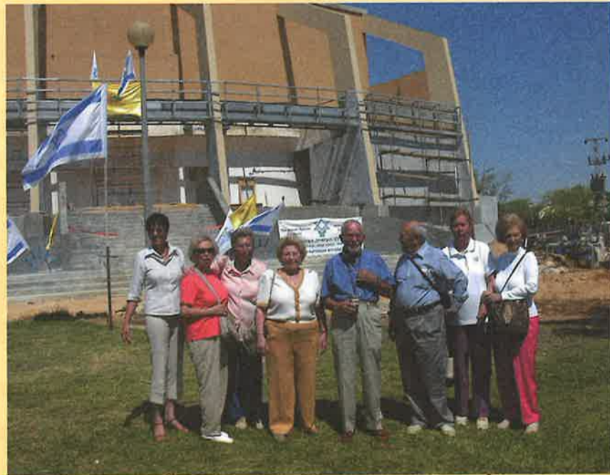
ביקור SHELTER FOR ISRAEL מלוס אנג'לס, ארה"ב. טקס הוקרה לתורמים להקמת אולם המופעים במרכז ספיר