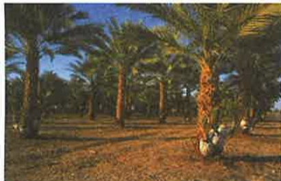
עונת הגידוד החלה