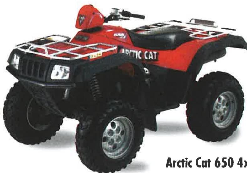
Arctic Cat 650 4x4 Automatic