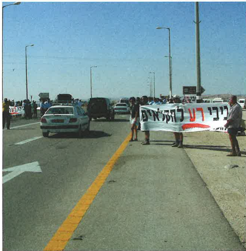
הפגנת תושבי הערבה שהתקיימה ב-21.9.03 בצומת עין יהב. בהפגנה השתתפו כ-200 מתושבי האזור

חותמת מ. הפנים המאשרת שהיו באיזון תיקים.