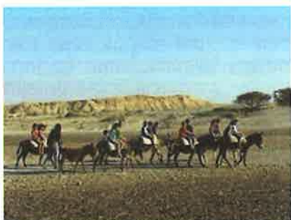
טיול חמורים - "לגעת בקיץ" 2003