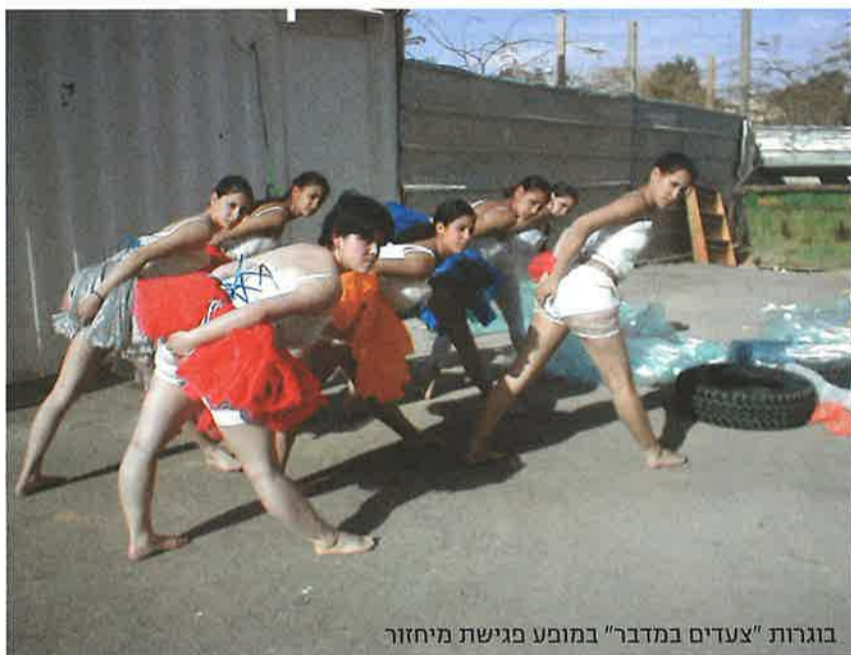
בוגרות "צעדים במדבר" במופע פגישת מיחזור

הפעילויות בימי שישי הן חוגי משוטטים, טיולים באזור, פעילות נוסף-אית ותנועתית. צריך להדגיש כי לא מדובר בפעילות מאורגנת בכל יום שישי. כמו כן, לא הצלחנו לממש פעילות לתגבור מתמטיקה ואנגלית בישובים בהם התכוונו לפעול בתחומים אלה.