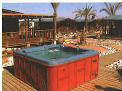
"פינה במדבר", מושב צופר