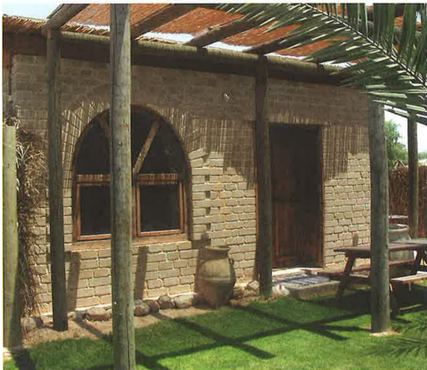
אתר "שבילים במדבר" במושב חצבה