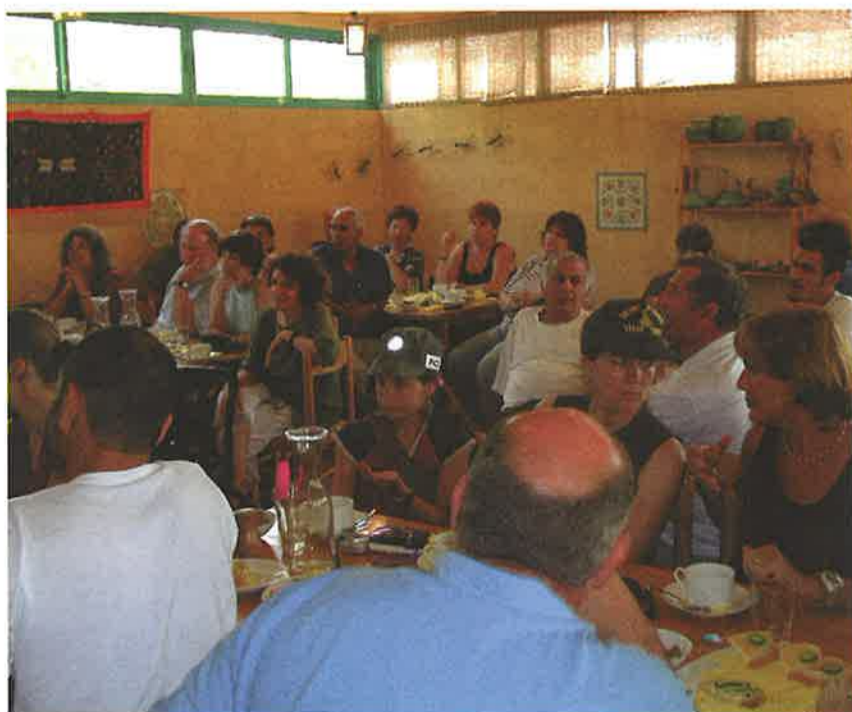
ארוחת בוקר ישראלית-בדואית