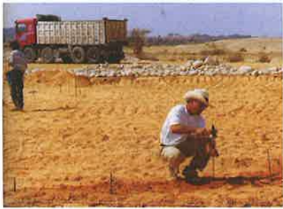
הפסל אנדרו רוג'רס בערבה

הפסל האוסטרלי אנדרו רוג'רס, אשר העניק לתושבי הערבה את הפסלים הסביבתיים המרהיבים Slice-1 Rhythms of life, Chai , העניק במתנה גם ספר צילומים ובו יצירותיו מכל העולם