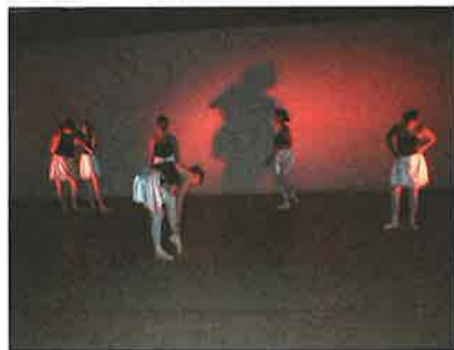
מאחורי הקלעים של מופע הסיום