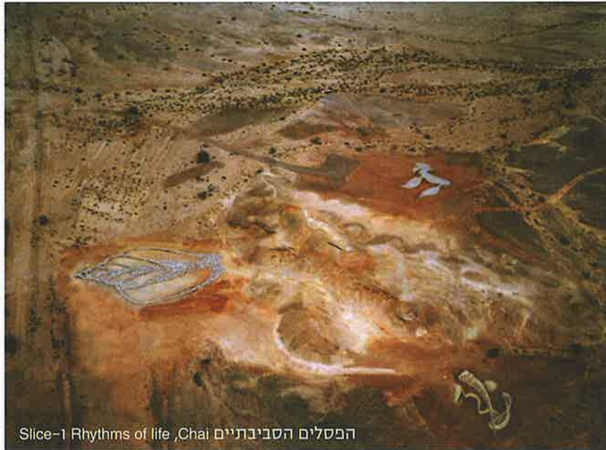
הפסלים הסביבתיים Slice-1 Rhythms of life, Chai

ביקורו הראשון בערבה, היה בשנת 1998 כחלק מפיתוח והידוק הקשרים בין תושבי הערבה ליהדות אוסטרליה. רוג'רס הוזמן להקים פסל סביבתי בערבה ומאז אף הקים שני פסלים נוספים. רוג'רס אסף תרומות באר שטרליה לבניית הפסל "חי" שנחנך במרץ 1999 ומסמל בעיניו את "חגיגת החיים". בבניית הפסל השלישי השנה, נעזר רוג'רס בחמישה עובדים, ארבעה אדריכלים, ושני טרקטורים בהצבתן של