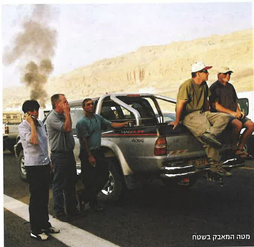
מטה המאבק בשטח