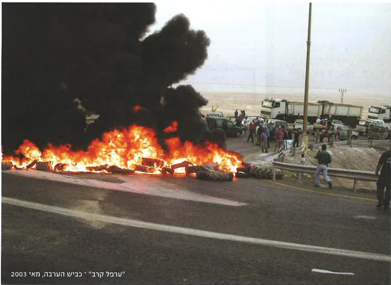
"ערפל קרב" - כביש הערבה, מאי 2003

המס יגרום למשק הממוצע המעסיק 8 עובדים, נזק שנתי של כ-25,000 ש. המיסוי החדש עלול לגרום למצב בו משקים רבים, המתקשים גם ככה להוציא את פרנסתם, יגיעו למצוקה כלכלית קשה עד לכדי פשיטת רגל. יש להדגיש כי בשל ריחוק האזור ממוקדי אוכלוסיה, פוטנציאל