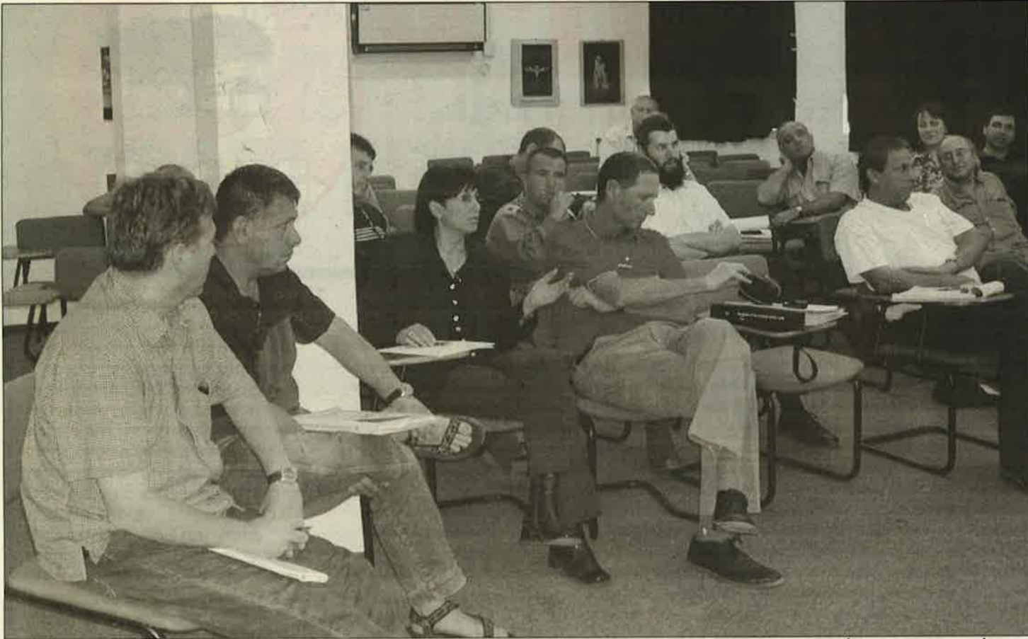
צוות מל"ח אזורי ביום השתלמות