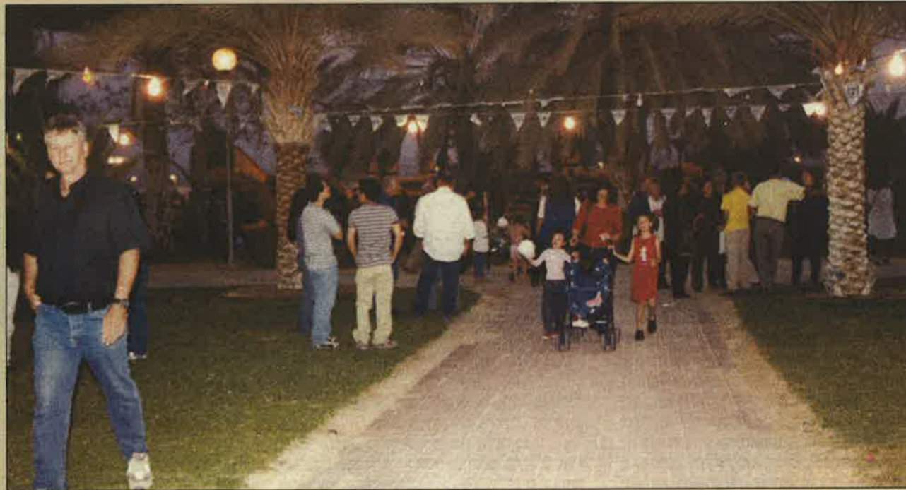
חגיגות יום העצמאות האזוריות בספיר