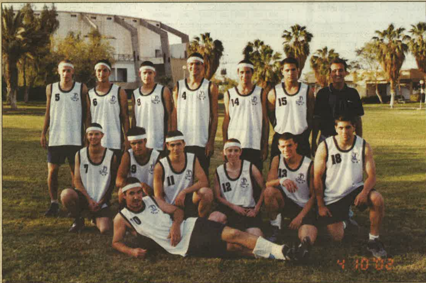
קבוצת נוער עובנה בכדורסל בליגה הארצית