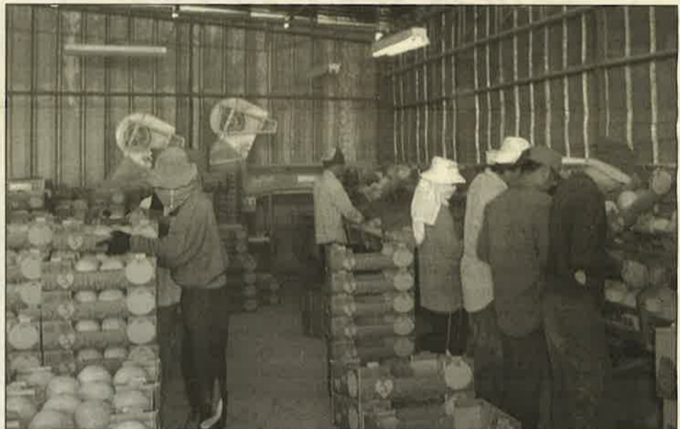
עובדים תאילנדים בחצבה. צילום אילוסטרציה