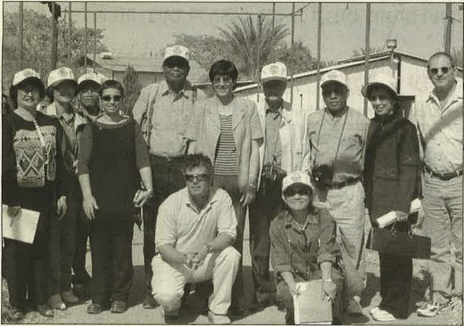
חברי המשלחת ומלוויהם בצילום קבוצתי

מנכ"ל משרד החינוך ההתיישבותי התאילנדי ומשלחתו הגיעו לביקור בן ארבעה ימים בערבה, לדון על המשך שיתוף הפעולה ולבדוק את תלונת שגריר תאילנד על עשיקת המשתלמים.