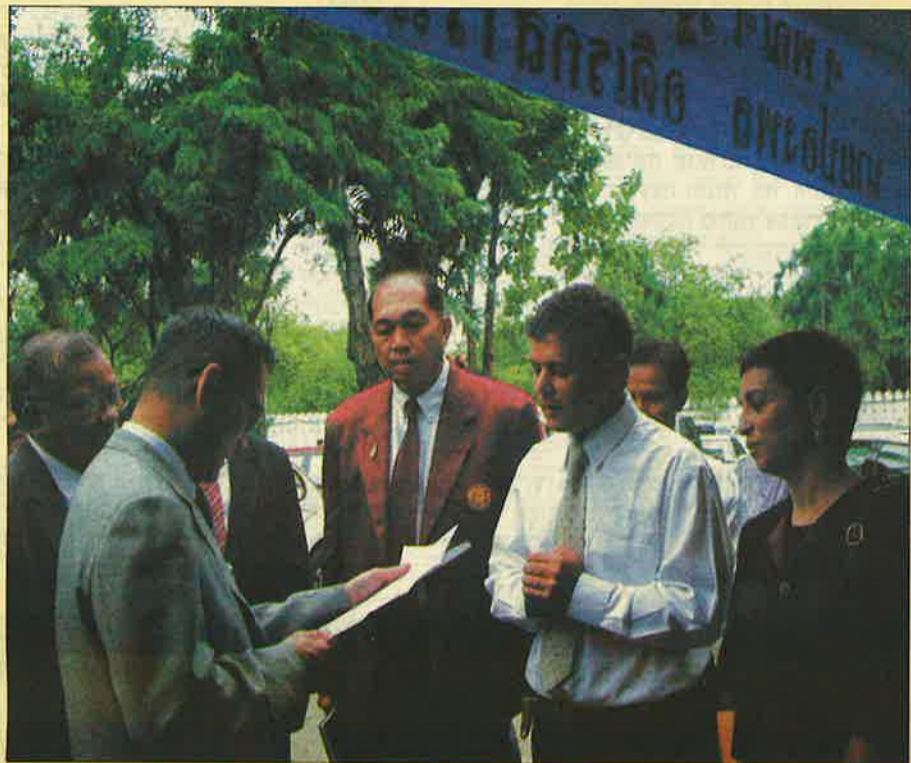
הגשת ההזמנה לביקור בערבה לשר החינוך התאילנדי, בבנגקוק, תאילנד.

שמו המלא של המרכז הנו A.I.C.A.T (Arava International Center For Agricultural Training) המרכז נוסד בשנת 1993, והשנה כולל המרכז 350 משתלמים מהמדינות: תאילנד, מינאמר, טיבט, ונפאל. המרכז מעסיק למעלה מ-20 אנשי צוות, רבים מהם מרצים ומנחים מהאזור