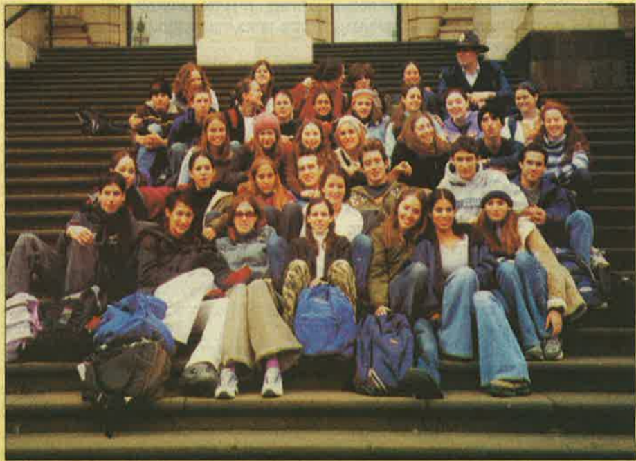
המארחים והמתארחים על מדרגות בית העירייה במלבורן, בחברת שוטר אוסטרלי טיפוס

הגענו ב-19 ביולי, עם ג'ט לג מטרופ לאחר כ-35 שעות של שדות תעופה, מטוסים ואוטר