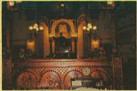
בית הכנסת האורתודוקסי במלבורן

רבות כגון האם יש לנו כאן טלוויזיה, מזגנים וכו', וניסינו להעביר את התמונה המיוחדת אך המתקדמת של האזור שלנו, הערכה. התארחנו אצל תלמידים מביה"ס "ביאליק", וזכינו לאי-רוח חם ומהנה, ושבת אחת בילינו אצל משפחות מתנועת "בני עקיבא", שבת שהיתה חוויה בפני עצמה. כיום האחרון בעיר ערכנו טיול ארוך לאתרי הטבע המרהיבים - 12 השליחים - שסיכם את שהותנו בת השבועיים במלבורן.