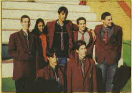
בני המשלחת במדי ביה"ס "עמנואל" ביה"ס המארח בסידני.

בהזדמנות זו אנו רוצים להודות באמת ומכל לב לזוהבה לחובבינו, המורה המלווה, אשר תמכה בנו, עזרה לנו ובעיקר היתה אתנו - אם בשעות