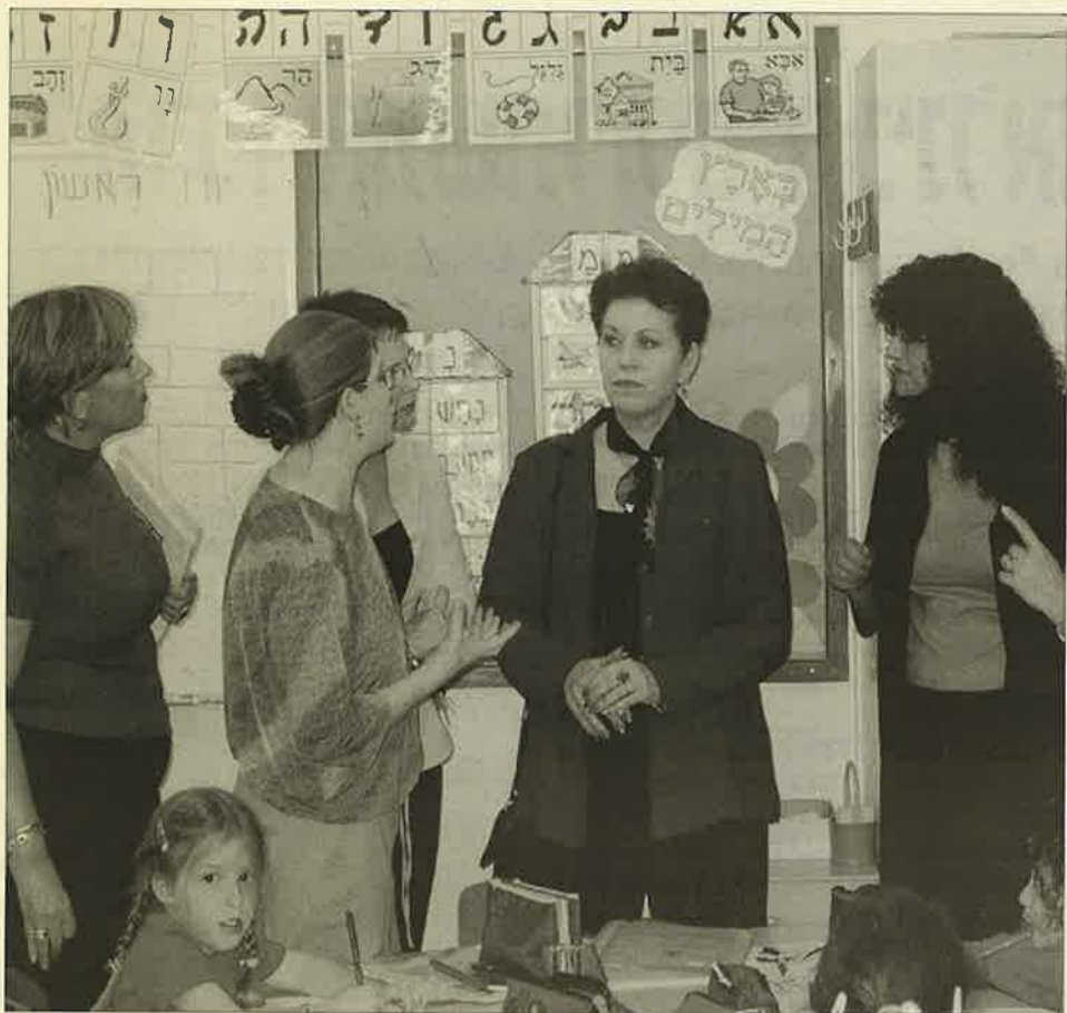
גברת עמיה חיים מסיירת בניה"ס היסודי "שיטים"

בדרך השלום, המו"פ ערבה, בגן ילדים בעין יהב ובבניה"ס היסודי, בו ביקרו בכמה כתות. נערכו פגישות עבודה עם ראש המועצה, גזבר המועצה, מנהל מח' חינוך, מנהלת ביה"ס היסודי, רכות הגיל הרך כמועצה ומנהלת התחנה הפסיכולוגית. במהלך היום ציינה הגב' חיים את חשיבות ביקור רים מעין אלה, המאפשרים להבין את הסוגיות והבעיות המיוחדות לאזור, להבין את משמעות המרחק הגיאוגרפי ולהעריך את העשייה בערבה על אף הקשיים האובייקטיביים.