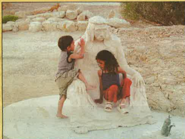
ילדי האזור נהנים מהפסל הסביבתי