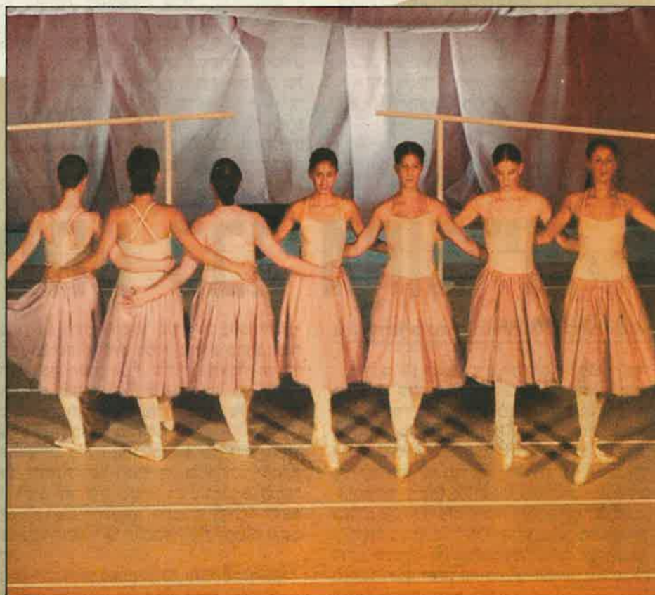
מתוך מופע "קסם המחול"