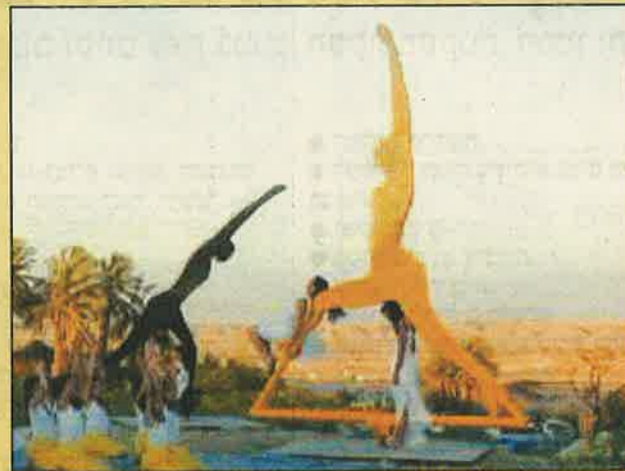
ריקוד המבוסס על הפסל הסביבתי