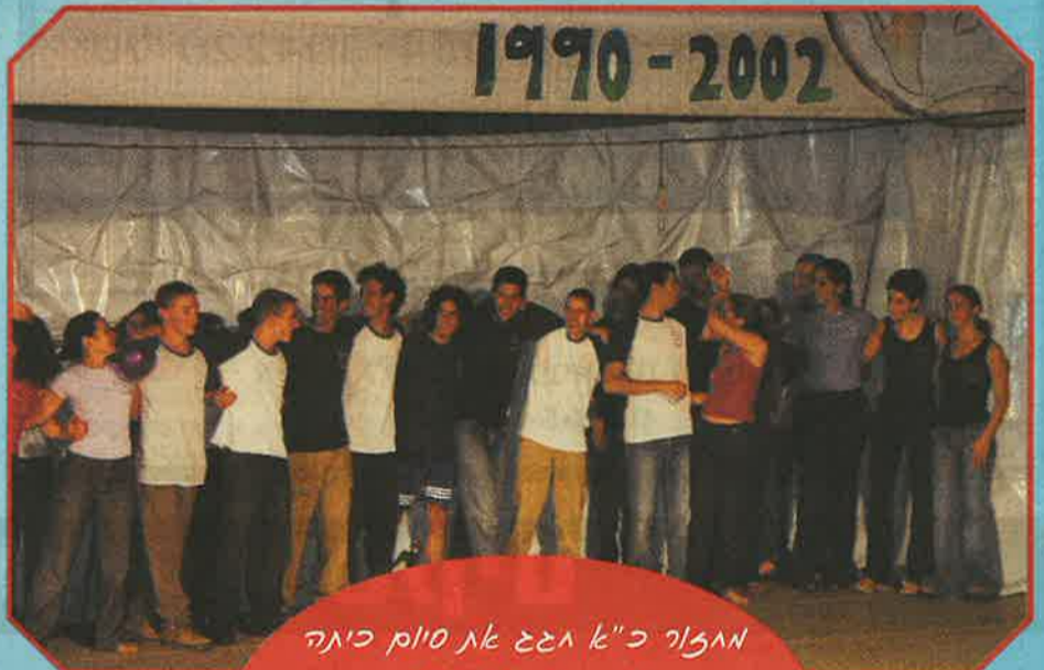
אמצור כ"א הגשן את סיום כיתה ו"ב ביום 29.6.02 בהצלה אבאזרוס בדרכי הגדשה ואתגשייסים - גיוס קא אנצוסו!