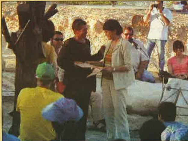
ראש המועצה מעניקה תעודות לאמנים