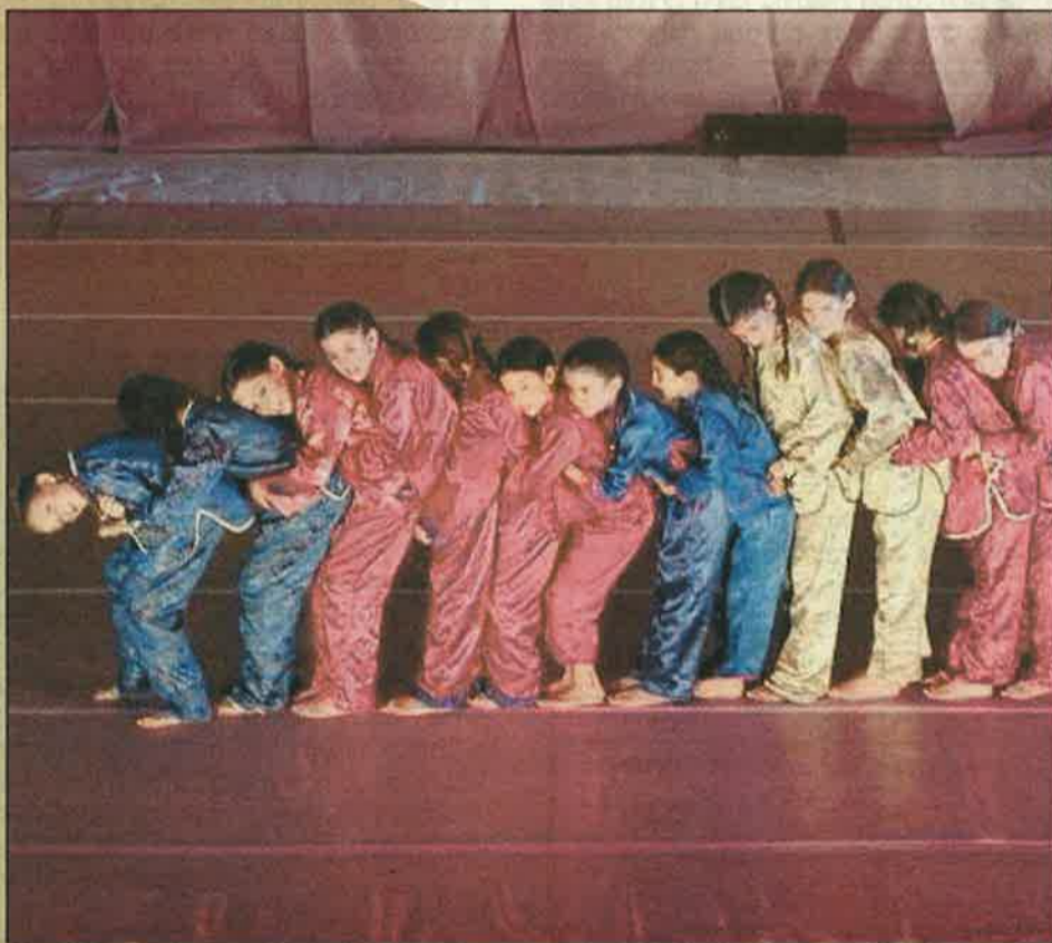
מחוך מופע "קסם המחול"