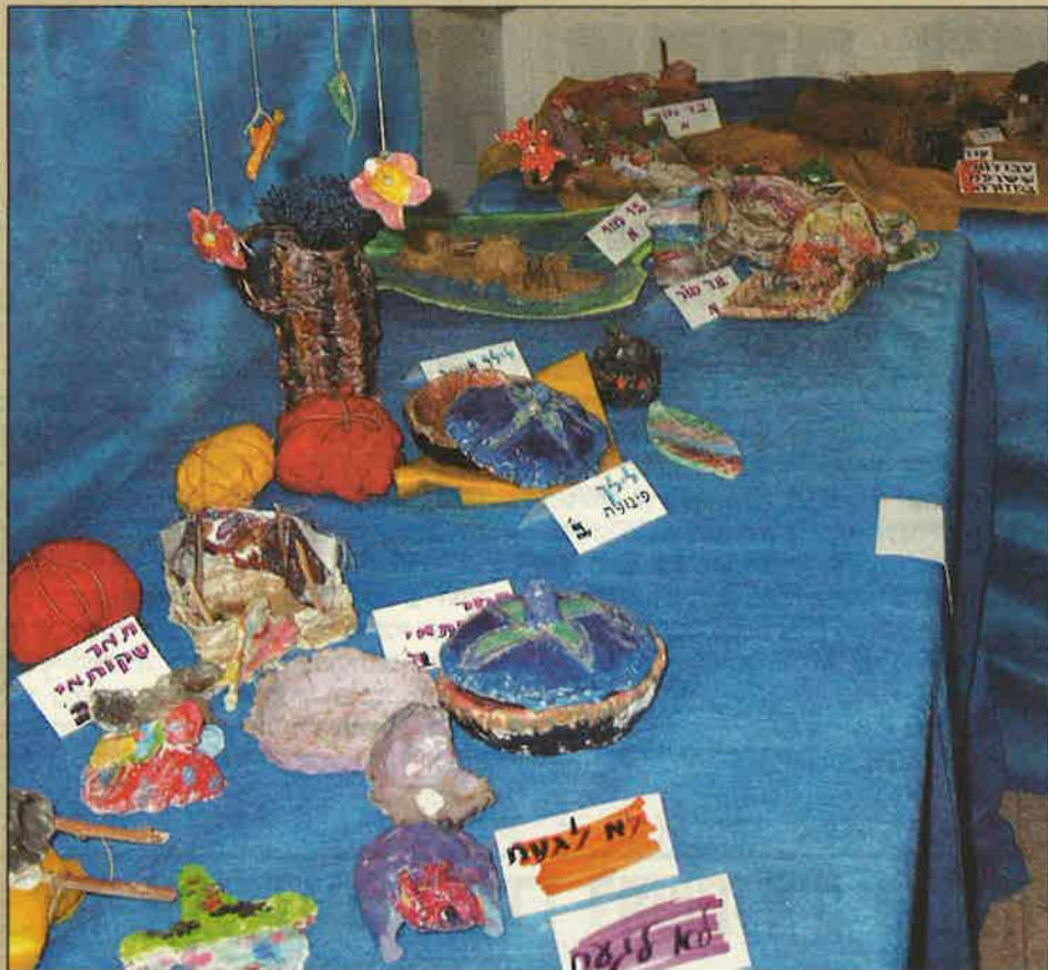
מיצירות האמנים הצעירים