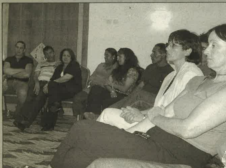
ביום 23.6.02 יצאו עובדי המועצה לטיול בן יומיים באזור ים המלח. במסגרת הטיול ערכו סיור לימודי במועצה האזורית תמר. בתמונה: העובדים שומעים סקירה מפי ראש המועצה.