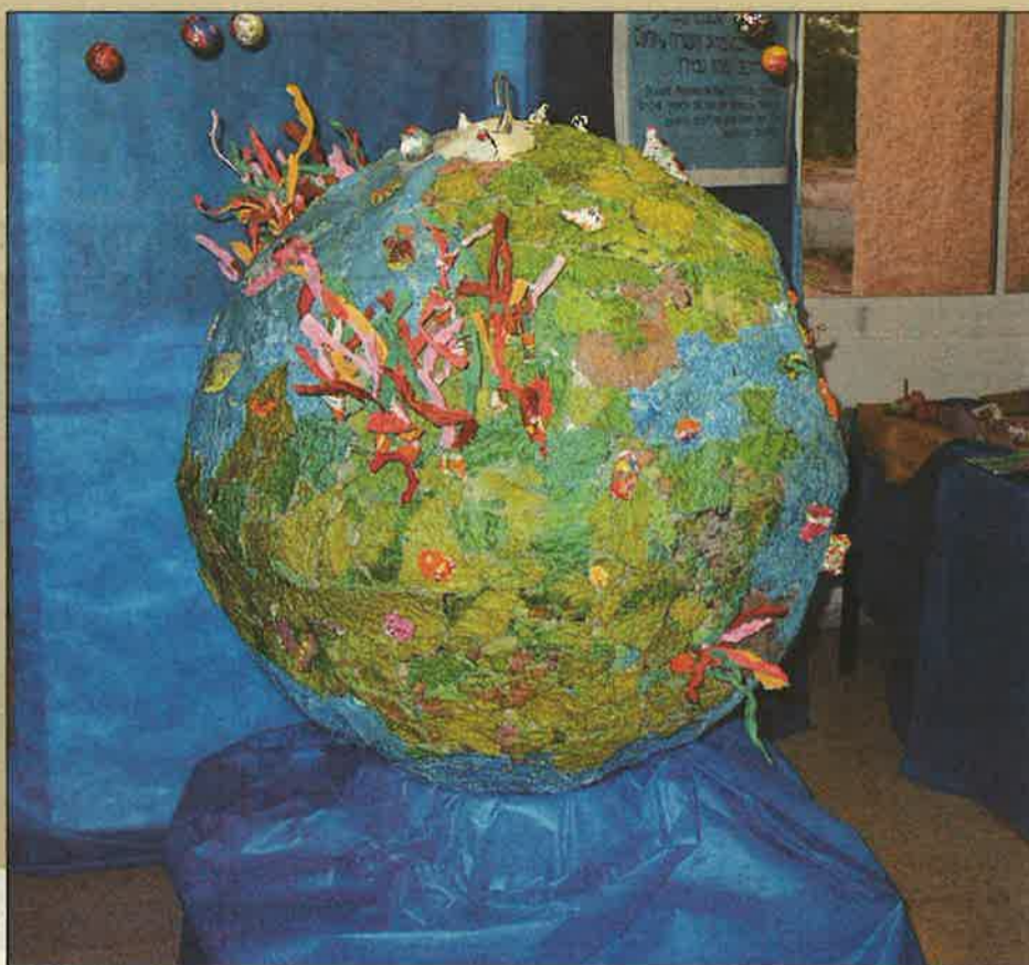
דגם כדור הארץ מחומרים ממוחזרים