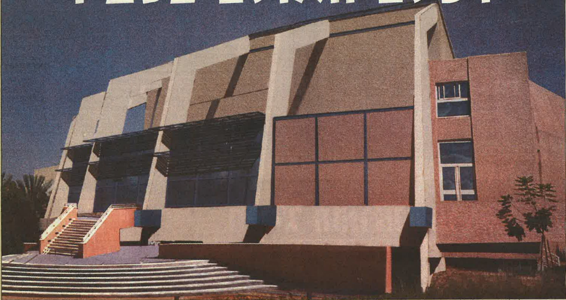
ביום 10.7.02 הוחלט לצאת במכרז להשלמת בניית אולם המופעים. תחילת העבודה - אוקטובר 2002, משך הביצוע - עד שנה. בתמונה: אולם המופעים בספיר - תמונת הרמייה.