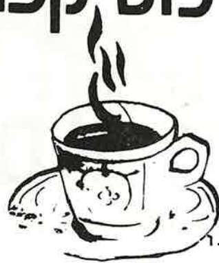
כתבה: גאולה קנר

פליקס: בני המצווה מגיעים אלי ולא מבחינים בין ימינם ובין שמאלם. מה להם לתורה ולתפילות? אך תוך כדי למידה הם מגלים ענין, וכמובן שהדבר דורש מהילדים מאמץ גדול, וממני טיפול אישי לכל ילד (והמחזורים הולכים וגדלים), ואל נשכח את החזרות הרבות עד השעות המאוחרות ביותר. אפשר לאמר שהילדים מגלים התלהבות והאווירה היא חיובית ביותר ואין בעיות משמעת. חשוב מאד לשתף גם את הבנות בטכס כדי שכולם ירגישו שותפים לארוע. הטכס הזה בא לספק את הצורך הנפשי שחשים המתישבים בערכה להחדיר ללב הילדים את הקשר לאדמת הערכה ולהסטוריה הקדומה של עם ישראל, שילוב המעמיק את התכנים היהודיים והציו-נייים.