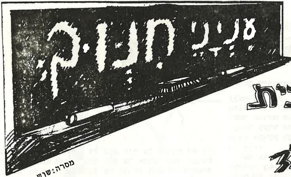
מסרה: שוש שירין