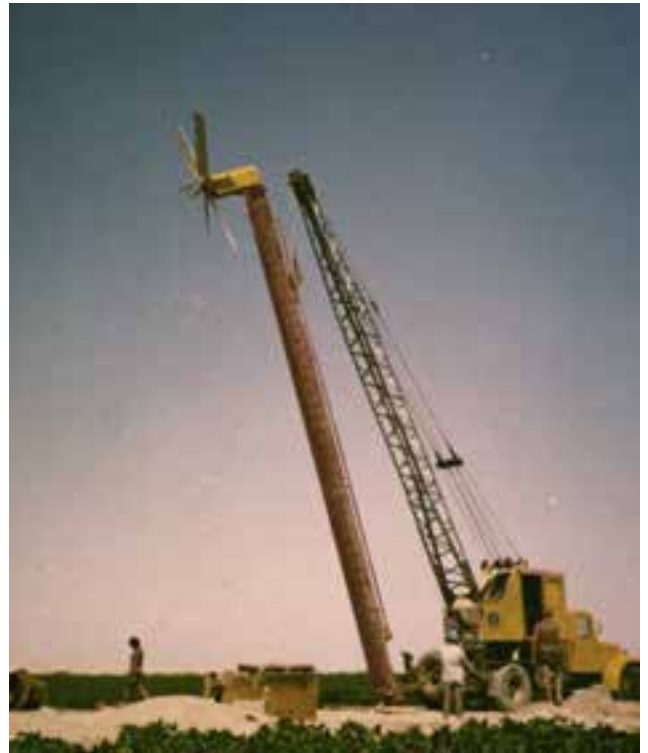
התקנת מאוורר נגד קרה

להדליית הפרחים ומעבר הדרגתי לבניית בתי רשת פשוטים בשלב ראשון, ומשוכללים בהמשך - הכול ביוזמה ובכישרון, המצאות של חקלאי פארן. מערכות ההדרכה והמו"פ עקבו