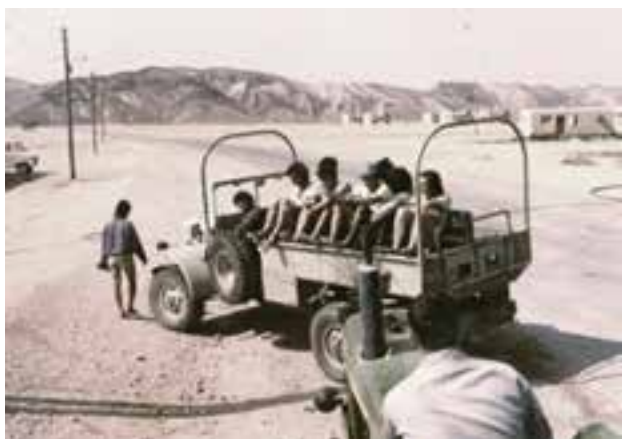
יוצאים לעבודה בשדה - 1973