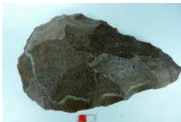
אבן יד מקוורציט מנחל זעף. שימשה לכל מלאכה

שרידי האדם הקדומים ביותר שנמצאו בערבה, הם מלפני 1.6 מיליון שנה. מדובר בכלים מאבני צור, גיר וקוורציט המכונים גרזני אבן. נראה שאחזו אותם ביד, ללא ידיהם והם