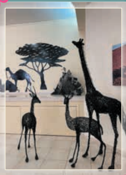
אמנות חוטי ברזל יוצרת: סמדר סיגלר