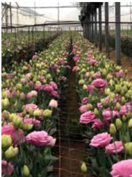
ליזיאנטוס – משק יונש

התייעלות מתמדת ושילוב גידולים חדשים וטכנולוגיות חדשניות. קשה לראות היום מגדלים חדשים שירצו להיכנס לענף, נוכח ההשקעה הגבוהה הנדרשת, כוח האדם הגדול שהענף מצריך והמורכבות שבניהול משק כזה. ללא עידוד והכוונה ממשלתית במימון ובריכוז מאמצים הענף לא יוכל להמשיך להתרחב ולהתפתח.