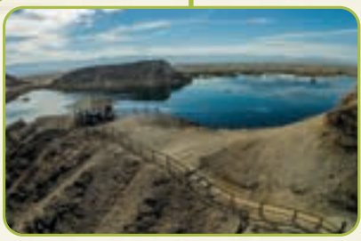
חנוכת מאגר עשת