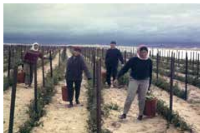
קטיף עגבניות בשנה הראשונה

עלה הרעיון שלפרנסתנו, נצא לעבוד בשטחים של חצבה ועין יהב, חברי הגרעין עבדו בכל עבודה מזדמנת. מיון עגבניות בעין יהב, בישול ארוחות והכנת סנדוויצ'ים לקבלנים השונים שעבדו בבנייה. אין ספק שהמוטיבציה של גרעיני הנחל הייתה גבוהה ביותר. חיילים בשירות ללא תשלום, שהתגייסו להקים ישוב, עובדים בעבודות מזדמנות במטרה לקיים את המושבוץ. בכלל לא מובן מאליו.