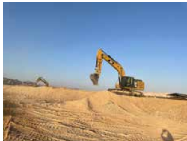
עבודות ההרחבה בפאון 2021

איך היית רוצה שפאון תראה בשנת החמישים? הייתי רוצה שתהיה יותר מעורבות וגם יותר אופטימיות. העניינים לא פשוטים, אני לא מזלזל, אבל אני חושב שאנחנו