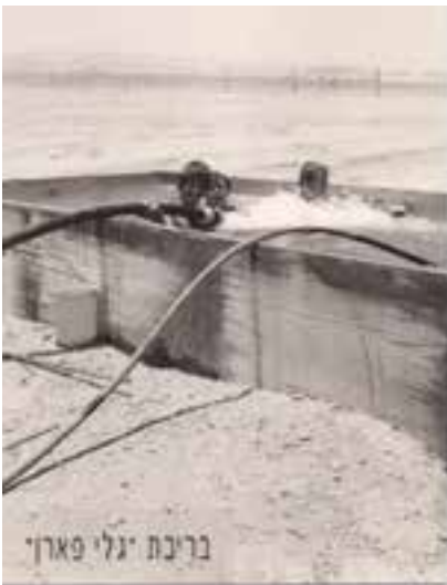
בריכת יגלי פארן

בנייתה של בריכת האגירה הראשונה על רכס עשת, על ידי חברת מקורות, הסתיימה זה מקרוב ובשטח נשארה גרוטאה של