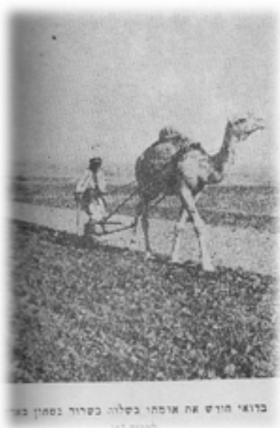
בדואי מוריש את ארמתי בקלה כשרור בסמוך באר לפני 1979

לפני 42 שנים, כשבאתי עם משפחתי, ביוני 1979 לחיות בפארן, שאלתי את עצמי מי חי כאן לפנינו?