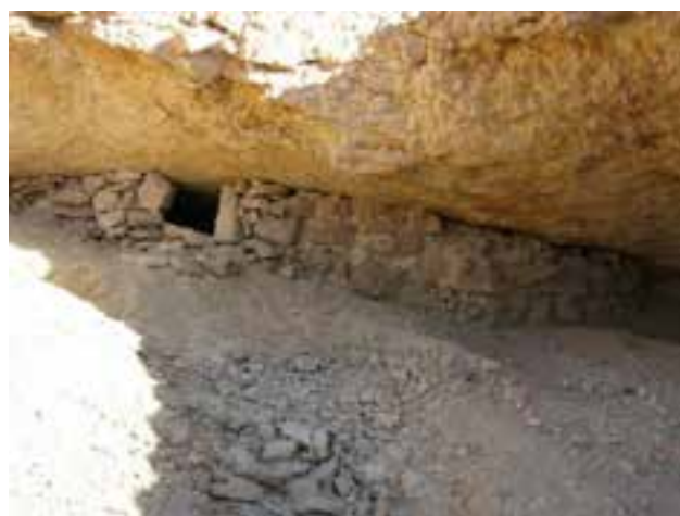
מטמורה (מחסן) בדווית, בנויה מאבנים ובוץ, מרכס מנוחה

השילוב של משק חי ומשק מזרע, היה המפתח לקיום באזור הערבה. יש להניח שבשנים שחונות מאוד, תושבי המדבר