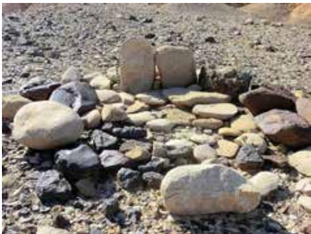
מצבה זכרית ומצבה נקבית עם משטח פולחני מצוקים

האבן. מצבות רחבות, היוו כנראה סמל לכוחות טבע ותופעות נקביות, כמו גשם, פוריות, צמיחה וכל מה שנלווה אליהם. מצבות מאורכות היו כנראה סמל לכוחות, תופעות והתנהגויות זכריות, כמו כוח פיזי, שליטה, הרג, ציד, סדר, ארגון, חוק. המצבות עשויות בדרך כלל מאבנים עמידות לבליה והן מוצבות בהרכבים שונים: מצבות בודדות, זוגות, שלישיות, חמישיות. לפעמים גדולות עם קטנות, מעין משפחות, בדומה לסידור של פסלי אלילים מהעולם הקדום, שמוצאים בארצות הגשומות והמוכרות יותר. השימוש באבנים לא מסותתות או עם סיתות מועט, מצביע על תפיסה רחנית של כוחות הטבע, ע"י האנשים שחיו כאן במדבר. כוחות הטבע ושאר הכוחות העליונים שהובנו כאן במדבר, כנראה הוליכו להבנה שהאל הוא כוח מופשט השולט בכל ההווה.