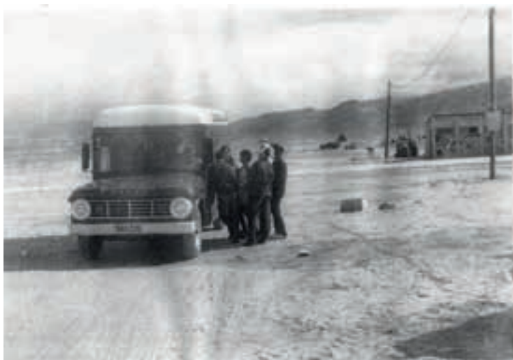
אוטו הדואר 1972

בהרי אגום כבר נראה השלש הראשון על הפסגות אצל היוס אמשלזא ראו אגם בכלל. הימים עוברים מהר נראה האסיפור הכליור סוכרור ומעניינות כבר רבים ומקלים וזה יופי כל פעם שחסי ביזור מחלטים על אסיפה ויש על מה אצבע סרטים כמעט ואין אגר עגה היו רק שניים אצל הם נקדעים כל כך הרבה שאפשר אהגגעה מגחילים אראגר סרט 2- 9:00 והוא נשאר 2-12:00 או אחג.