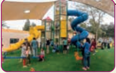
גן השעשועים החדש והג'מבורי