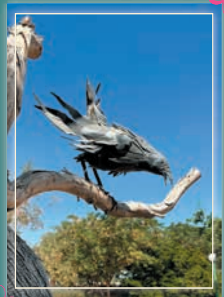
אמנות בברזל יוצר: חמי ברקק