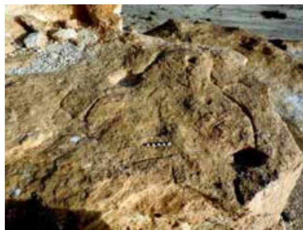
אתר פולחני מיוחד נתגלה על גבעת משאר גבוהה ליד נחל פארן, סמוך לכביש 90. באתר מזהים גומות ותעלות קטנות חצובות בסלע. האתר שימש כנראה לטקסי הקרבה, עם דם שנאסף בגומות.

השרידים המאוחרים, הקרובים לימינו, דומים מאוד לשרידים הקדומים. באתרי חנייה רבים מוצאים פריטי אבן פרהיסטוריים לצד חרסים מאוחרים ממאות השנים האחרונות. מזהים גדרות אבן, משטחי מגורים במחסות סלע, חללים בין סלעים ששימשו כמגורים ואחסון עם