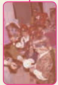
גן הילדים הראשון