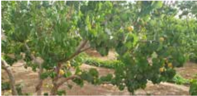
עצי מיִּשְׁמֵשׁ בחלקת המו"פ

אלו יכולים לצאת מוקדם בעונה ולפדות מחיר גבוה. יש לציין שגידולים אלו דורשים מים באיכות טובה ממי הקו שלנו. כמו