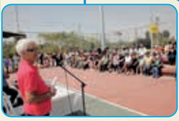
חנוכת מגרשי הספורט