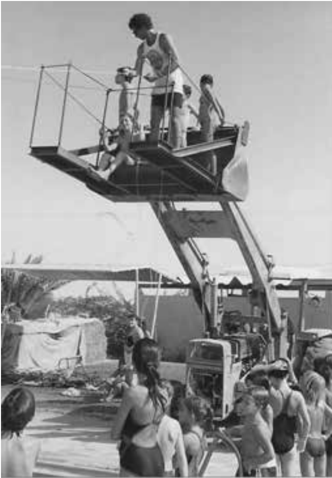
אומגה ביום הילד

הכביש של הבוסטרים. מכיוון המאגר מזרחה, כביש ישן שמתפתל בין הקידוחים שהיום נמצאים בשטח ירדן. בסופו מגיעים לקידוח האחרון, כמעט מול הסיבוב הגדול. אחלה מסלול לאימונים לקראת מסע האופניים של שנת הבר מצווה בכתה ז'.