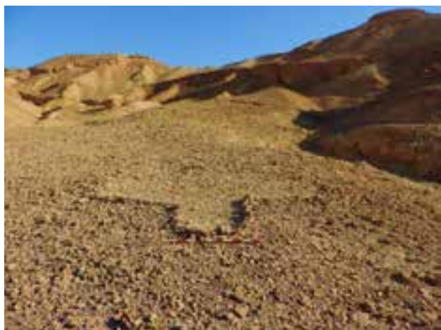
מסגד זעיר מכפת עשת.

נדדו עם משק החי לאזורים מעט יותר פוריים בשולי המדבר. אפשר להניח, שהיו עוד מקורות קיום בערבה, כמו מתן שיחותם לשיירות שעברו בערבה, אספקת כוח אדם, בהמות, מכירת מזון ועוד. יש עקבות לכרייה של גופרת בכיפת עשת ומעט עדויות להכנת פחמים.