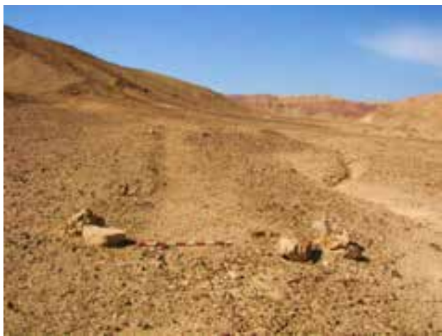
עקבה של נול על הקרקע סמוך למאגר עשת. זוגות האבנים יצבו את הנול

תוספות בנייה. בכל אתר מגורים כמעט, מזהים עקבות לגידול מקנה. יש משטחי רביצה, מכלאות לצאן וכן מלכודות לטורפים כהגנה על הצאן. כאן בערבה הייתה ממש תרבות של משק חי. החפצים החשובים ביותר לרוצי הצאן (בעיקר רועות), היו מוטות להסרת מזון מהעצים - בעיקר עצי שיטים. עם מוטות אלו שכמה מהם נאספו, הפילו עלווה, פריחה עשירה בחלבונים ותרמילי זרעים כמזון למקנה.