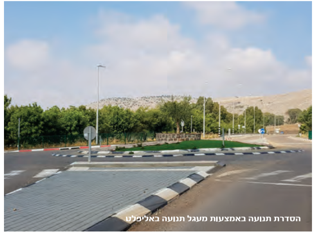
הסדרת תנועה באמצעות מעגל תנועה באליפלט