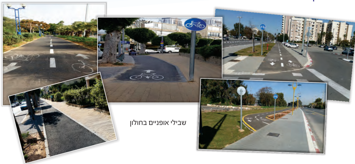
שבילי אופניים בחולון

יש להקפיד על תכנון השבילים בהתאם להנחיות התכנון של משרד התחבורה. למשרד שיקול דעת מלא שלא לבחון תכנית שתוגש שלא בהתאם להנחיות אלה.