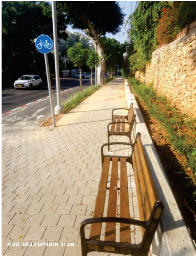
שביל אופניים בכפר סבא