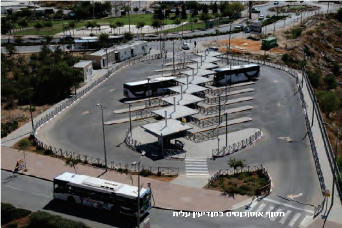
מסוף אוטובוסים במוזיעין עלית