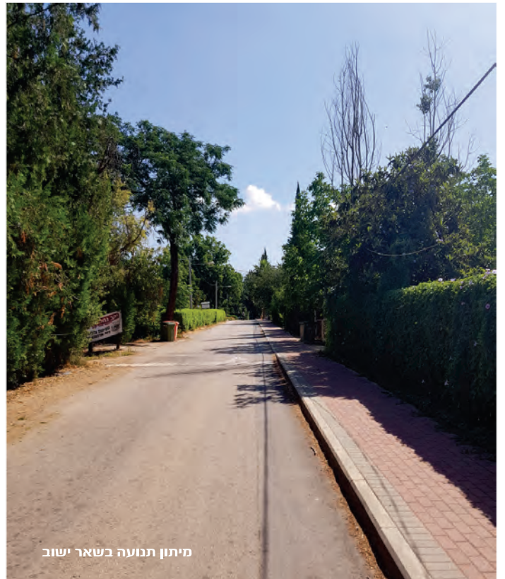
מיתון תנועה בשאר ישוב