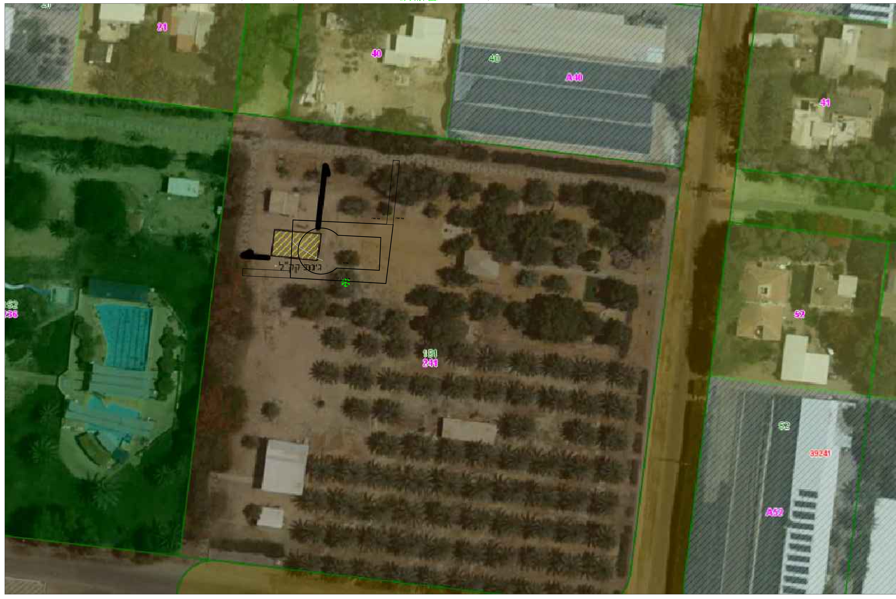
מראה כללי 1:500