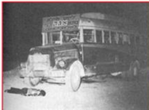
אוטובוס הדמים, 11 מנסעי נרצחו במעלה עקרים, מרס 1954

בדרכי חזרה מהמפגש, שעברתי בשלום, הגעתי לאוטובוס במעלה העקרים זמן קצר לאחר ביצוע הטבח. האוטובוס מספר 3183 היה נקוב בכדורים. התוקפים בחרו במקום אידיאלי למארב, באחד הסיבובים החדשים של מעלה