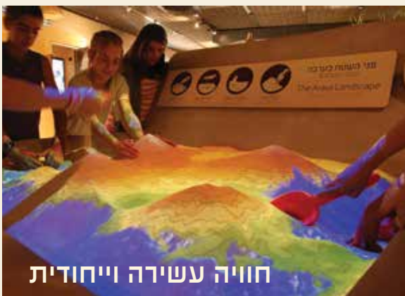
חווייה עשירה וייחודית

המרכז מחוקם על כביש הערבה, בתחנת מחקר ופיתוח "יאיר", ליד צומת חצבה