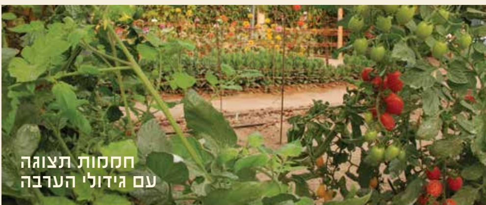
חממות תצוגה עם גידולי הערבה