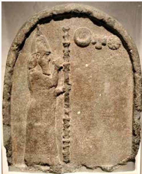
נבונאיד והאלוהויות האסטרוליות (אלי השמים) על גבי תחריט מחרן (British Museum Archive) זהו העתק זהה במרבית פרטיו לתחריט מסלע אך מצב השימור שלו טוב יותר