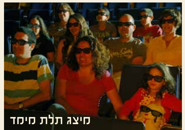
סיצה תלת חימד