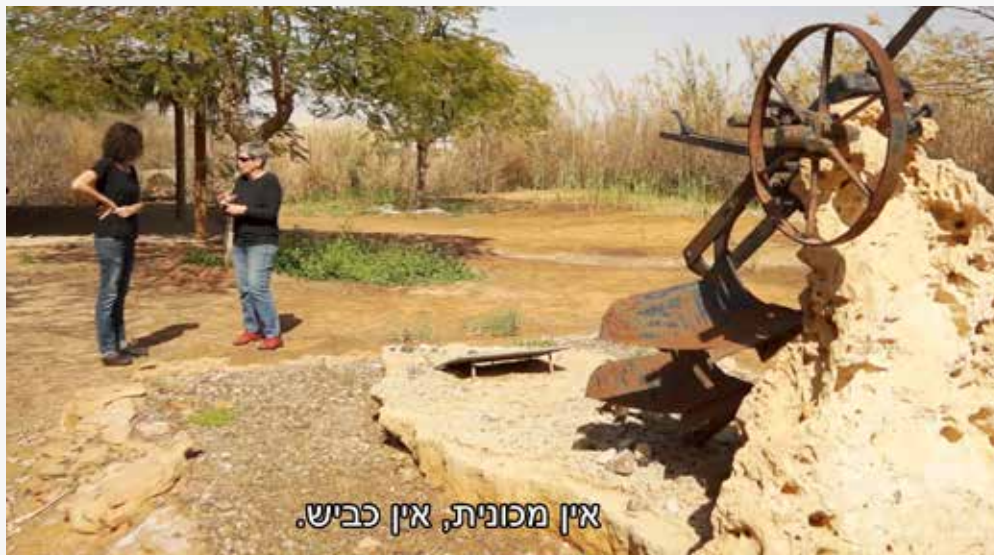
אין מסננת, אין כביש.

איך עברה עלייך ההקרנה הפומבית הראשונה? "קדמו לה הרבה פרפרים בבטן. דאגתי מאוד איך ירגישו המספרים המשתתפים שהיו פתוחים וחשופים לגבי עצמם וחייהם בצילומים של הסרט. דאגתי וקיוויתי שהם ירגישו שהסרט נותן כבוד להם ולסיפור שלהם. חששתי גם שאולי הם ירגישו שהסיפורים האישיים שלהם לא קיבלו ביטוי מספיק. שמחתי מהתגובות בהקרנה עצמה ואחריה. אבן נגולה מעל ליבי."