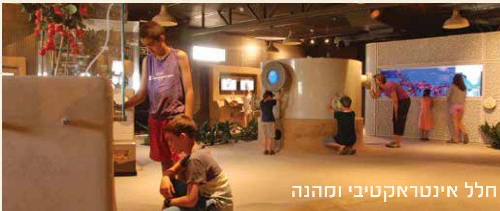
חלל אינטראקטיבי ומהנה