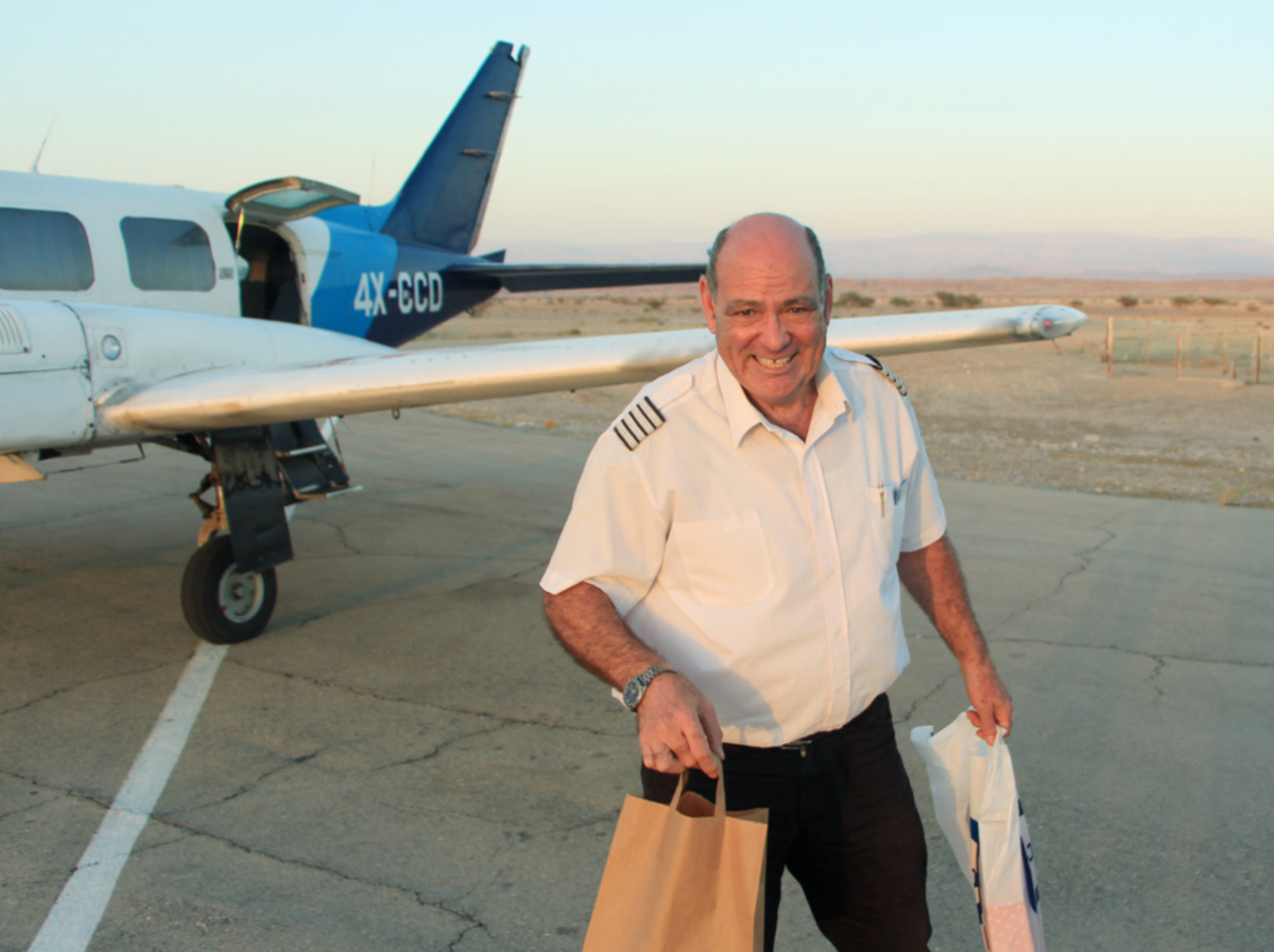
עמי פורת לאחר הנחיתה במנחת עין יהב במטס הפרידה