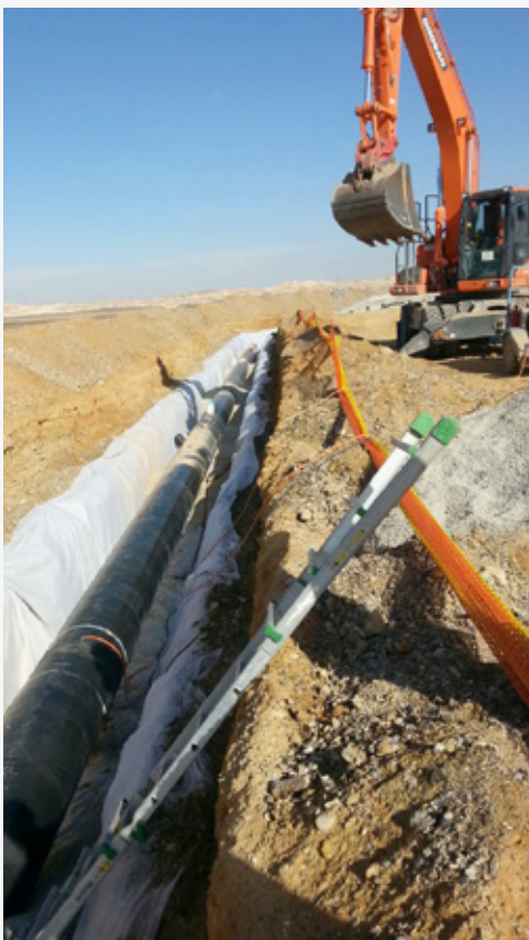
צילום: יובל פלאוט