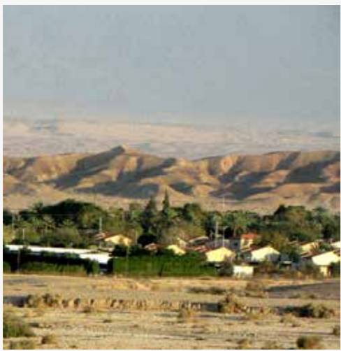
מושב עין יב