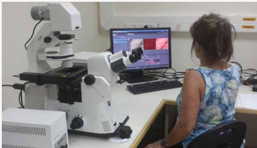
מיקרוסקופ אפוטום של חברת "זייס" במעבדה בתחנת יאיר

במבנה המעבדות במו"פ הותקן מיקרוסקופ חדשני, המאפשר להתבונן בהגדלות גבוהות במבנה תאים של צמחים, אצות, תאים סרטניים וביצורים חיים בזמן אמת: דגי זברה, נמטודות וכדומה. צוות ה"מעבדה לגילוי תרופות" כבר משתמש במיקרוסקופ זה במחקר של מחלת ה-ALS (ניוון שרירים) במטרה לאפיין את מבנה הצומת שבין תאי העצב לשריר. במחלת ה-ALS מתפתח בהדרגה ניוון של השריר עקב חוסר עצבו שגורם לשיתוק ומוות.