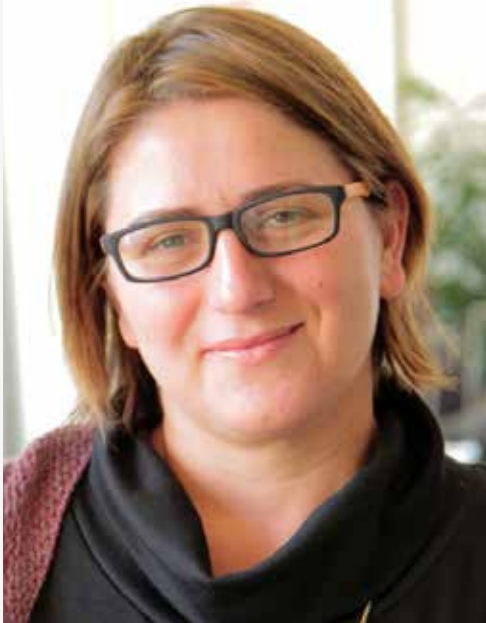
אופיר. לגעת באנשים