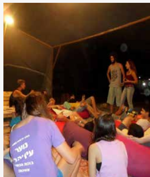
"באבלילה". מועדון נוער נייד

נעה טלשיר, רכזת מצילה ורכזת טיפול בפרט, מחלקת חינוך