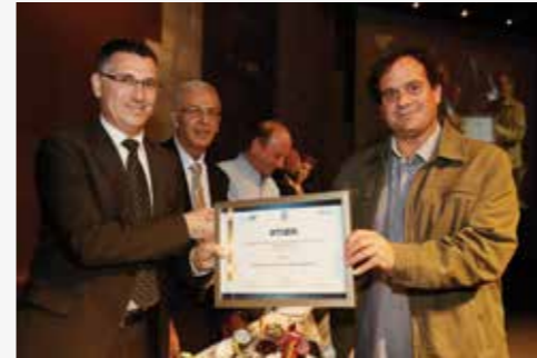
פרס ניהול תקין

בתחום רישוי העסקים תיושם בקרוב רפורמה שבמסגרתה יונהג מסלול מהיר שמטרתו לקצר ולהקל את ההליך להשגת רישיון העסק. כיום הליך קבלת הרישיון אורך ארבעה חדשים לפחות, וזאת בשל עיכובים בקבלת אישורים מהרשויות הממשלתיות. במסלול החדש יצהיר מגיש הבקשה בפני עו"ד כי פעל לקבלת האישורים. התצהיר יאפשר קבלת רישיון עסק זמני ובמהלך השנה הראשונה המועצה