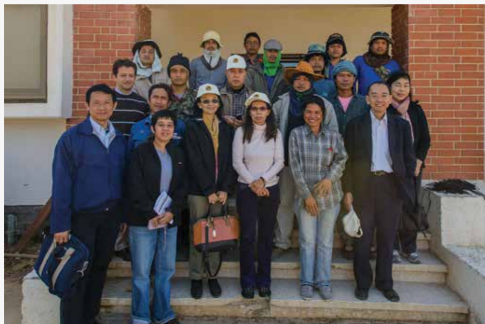
נציגי משרד העבודה התאילנדי ונציגי ה-I.O.M בביקור בערבה צילום: גלעד לבני

לקראת העונה הבאה ישנה כוונה להגדיל את מעגל התשומות שנרכשות בערבה בניהולו של מנהל הרכש, אשר לביא. הדבר החשוב ביותר הוא הצטרפות חקלאים נוספים למעגל ואין צורך להסביר את חשיבות הנושא.