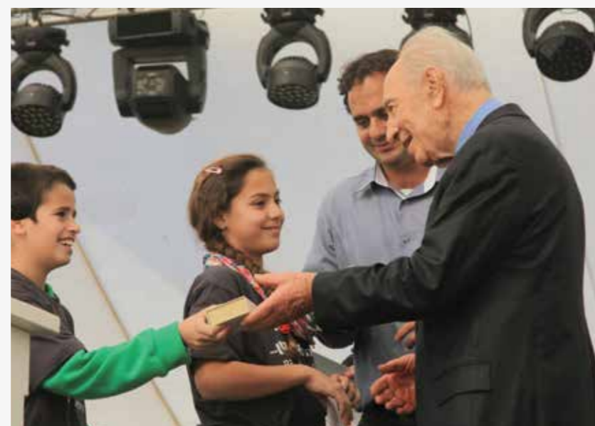
מימין לשמאל: תלמידי ב"ס שיטים מעניקים לנשיא המדינה את סיכת הערבה במסגרת אירועי הפתוח, ארווין ולוטי ויידור עם נציגי קק"ל