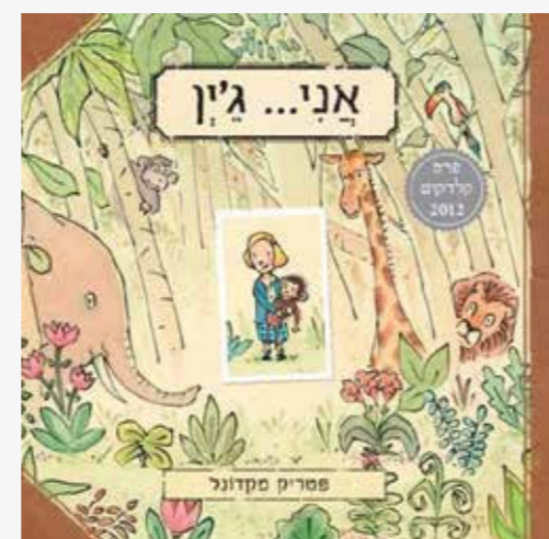
מימין לשמאל: עטיפת הספר, שימפנזה והחוקרת ג'ין גודול

ספר הילדים "אני ג'ין" מספר את סיפורה של ג'ין גודול, חוקרת השימפנזים. הילדה ג'ין אהבה מאוד את הטבע ואת בובת השימפנזה שלה - ג'ובילי. ג'ין גדלה באנגליה וראתה את הטבע, החיות והצמחים כפלא. היא אהבה מאוד לקרוא בספרים וללמוד על בעלי חיים וצמחים, אך בעיקר אהבה להקשיב ללב שלה פועם, פועם ופועם. חלומה הגדול של ג'ין היה לחיות באפריקה ולחקור את הקופים ואת דרך החיים שלהם.