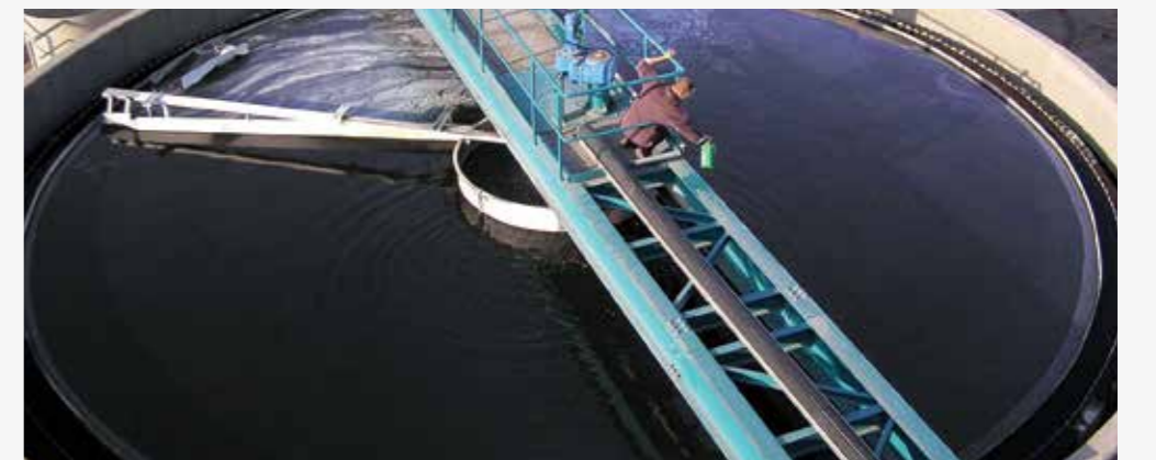
מתקן טיהור שפכים יטבתה.