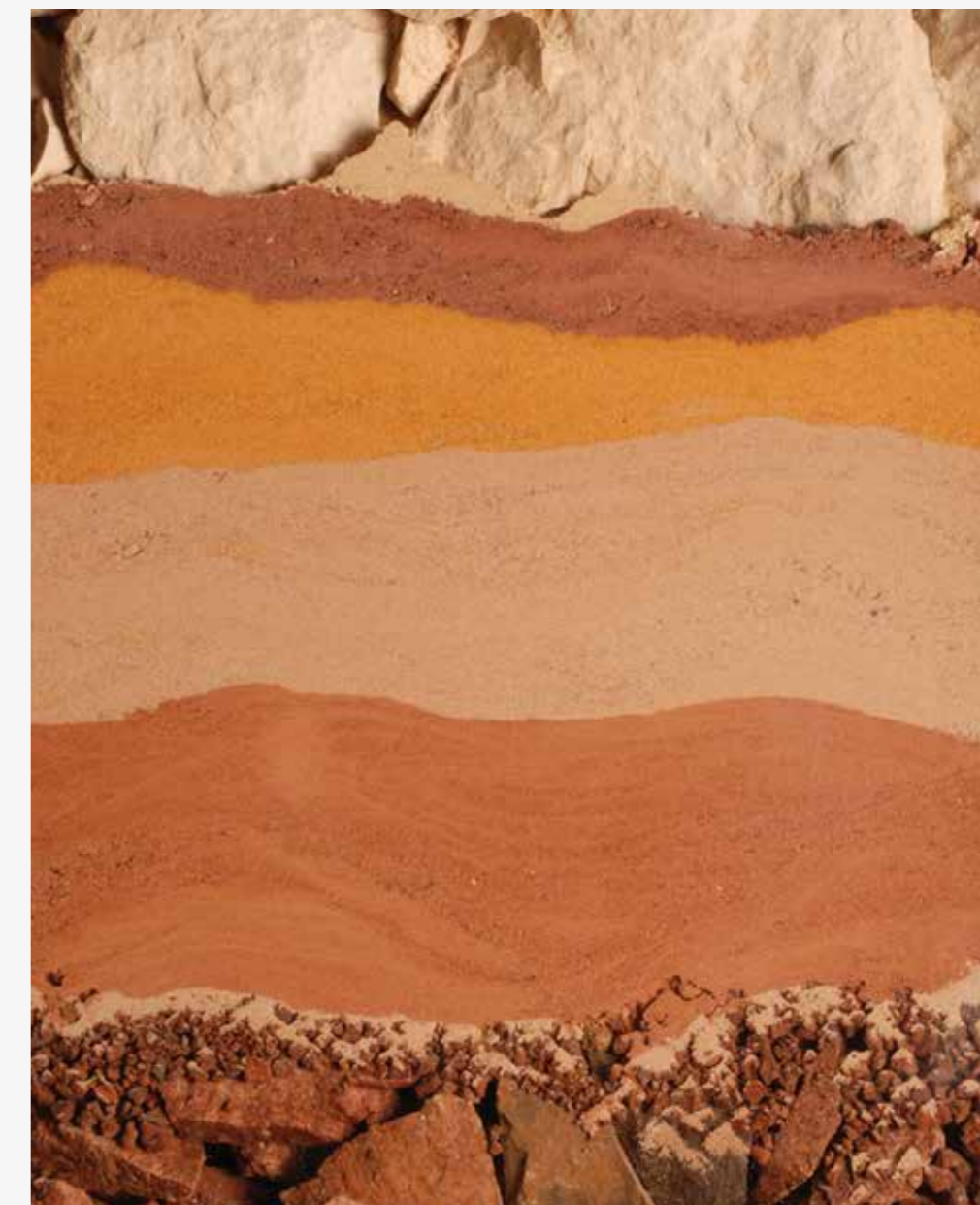
מומלץ להצטייד בבקבוקים למילוי. חולות צבעוניים

נסיעה לאורך ציר מעלה עקרבים וטיול רגלי בנחל גוב מספקים טיול מהנה ברכב, המשלב קטעי הליכה קצרים ושכשוך מרענן בעין ירקעם לקינוח