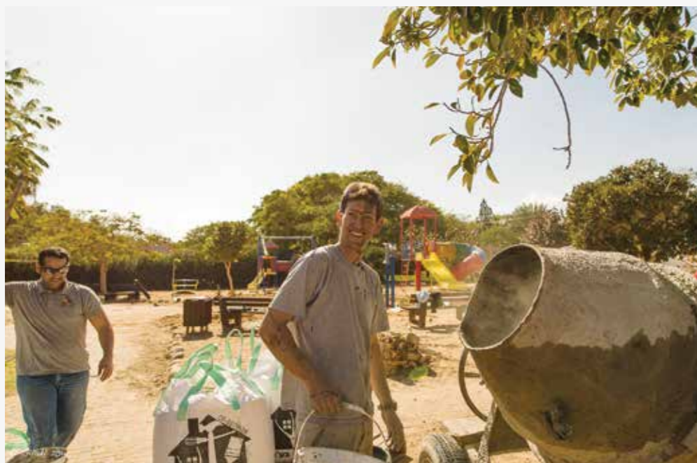
גן השעשועים החדש בצופר. הצעירים נרתמו להקמת המתקנים.