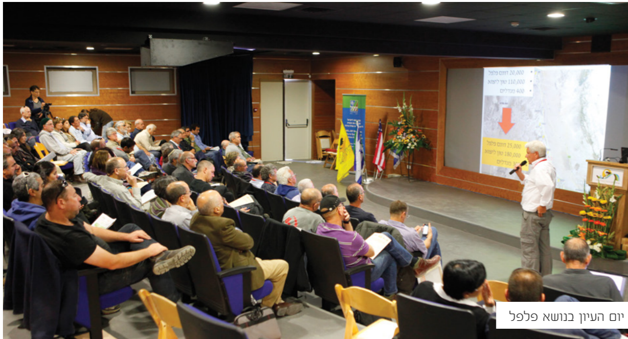
יום העיון בנושא פלפל

כנס בנושא הפלפל, כנס בנושא מים, טקס הוקרה לפעילות קק"ל בערבה, חלוקת מלגות ויותר מ- 200 דוכנים וביתנים ססגוניים של חברות מובילות בתחום החקלאי, חיכו השנה ל- 20,000 המבקרים בתערוכה שהגיעו לערבה והתעלמו ממזג האוויר.