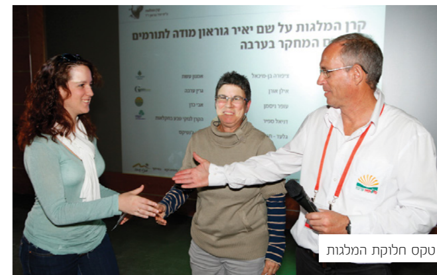
טקס חלוקת המלגות

הפלפל הוא מוצר הדגל שלנו. 120,000 טונות ליצוא וכ- 80,000 טונות לשוק מקומי הן כמות אדירה המגיעה מאזור אחד. בכל שנה אנו כוססים ציפורניים ומקווים שהעונה תסתיים בטוב, שיהיו עובדים זרים ושהמחירים יהיו סבירים. כשזה לא כך, יש מקום לדאגה ממה שעלול לקרות לאזור שבו יותר מ-60% מהחקלאים מגדלים גידול אחד - פלפל. הפלפל נחשב לגידול נוח ויציב, מבטיח