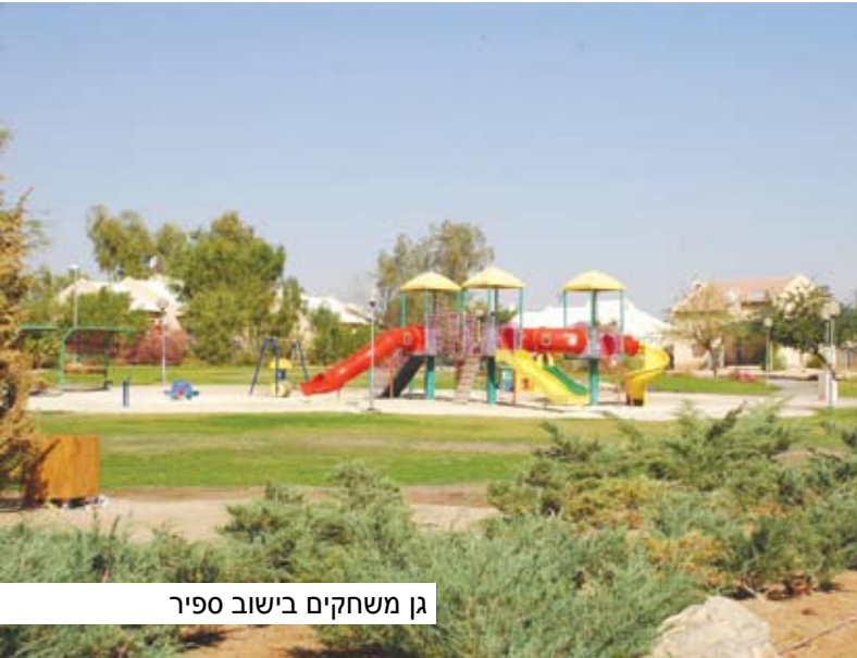
גן משחקים בישוב ספיר