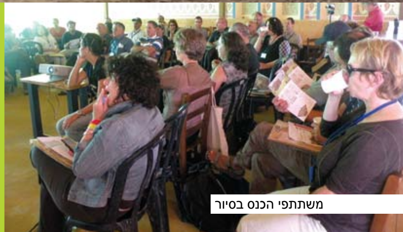
משתתפי הכנס בסיום