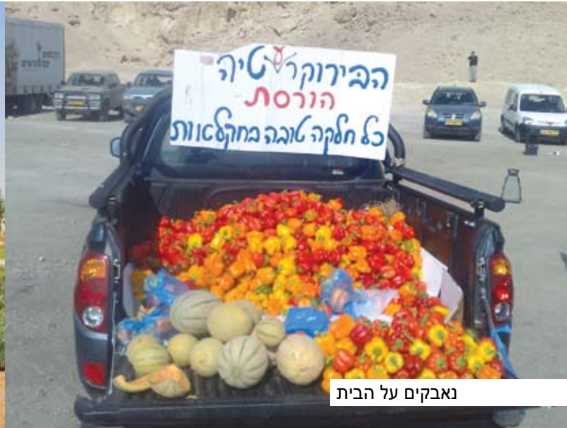
נאבקים על הבית