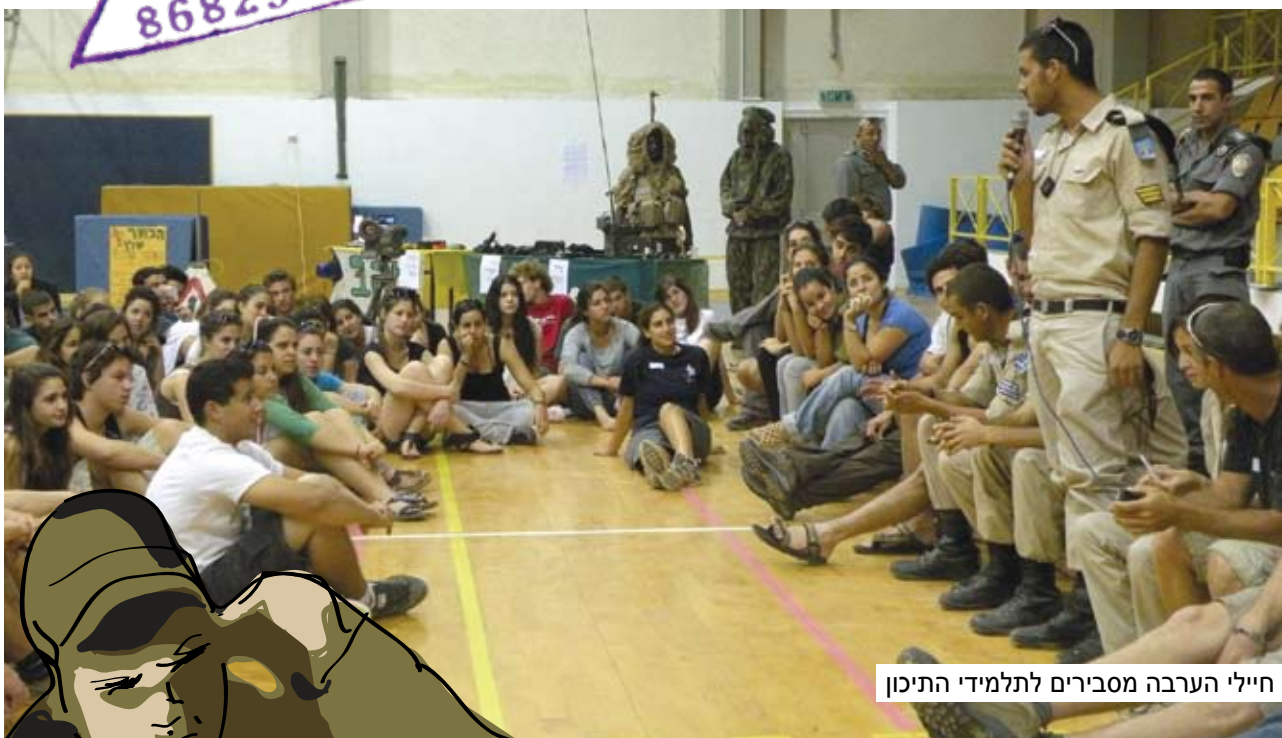
חיילי הערבה מסבירים לתלמידי התיכון