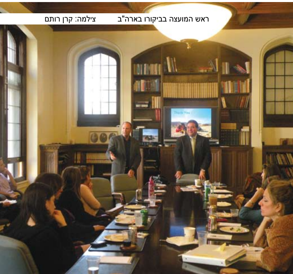
ראש המועצה בביקורו בארה"ב