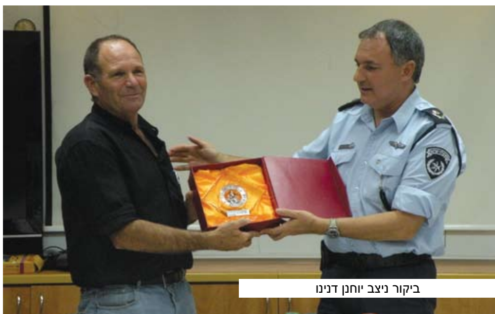
ביקור ניצב יוחנן דנינו

ביחידת החילוץ ערבה. לאחרונה אירחנו את מפקד המחוז הדרומי במשטרה, ניצב יוחנן דנינו, שהבטיח לסייע בנושאים הקשורים ליחידת החילוץ והן לנקודת המשטרה בספיר. לאחרונה התבשרנו על מינויו למפקח המשטרה ואנו מאחלים לו הצלחה רבה ומקווים שגם עם מחליפו נזכה לאוזן קשבת, תמיכה ושיתוף פעולה. מתוך הערכה רבה והוקרה לפעילות התנדבותית בכלל ולכזו הקשורה לביטחון והצלה בפרט, יזמה המועצה ערב הוקרה למתנדבי