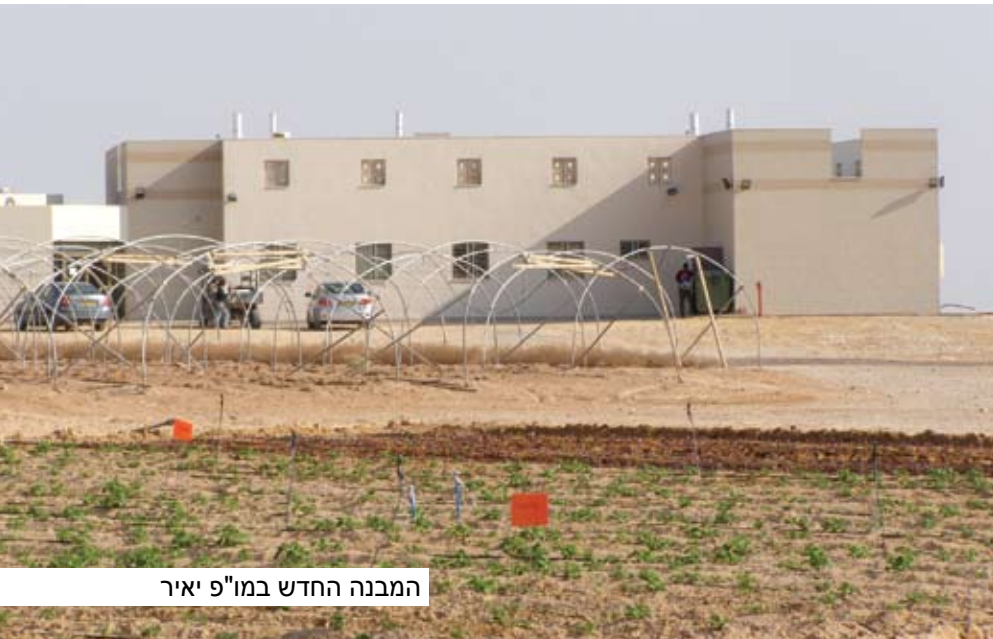
המבנה החדש במו"פ יאיר

“בנגב יבחן העם בישראל ובמולדתו” אמר בן גוריון ו”אין כמו קסם הערבה” כתב תלמידו, כבוד הנשיא שמעון פרס, בביקורו הקודם בערבה, בשנת 2009. הקסם הזה, הוא תוצאה של אמונה רבת שנים, נחישות, עקשנות והתמודדות בלתי פוסקת שלנו בבידוד, באיתני הטבע, במחלות ומזיקים בחקלאות לצד אתגרים בירוקרטים, מחסור בתקציבים ובידיים עובדות.