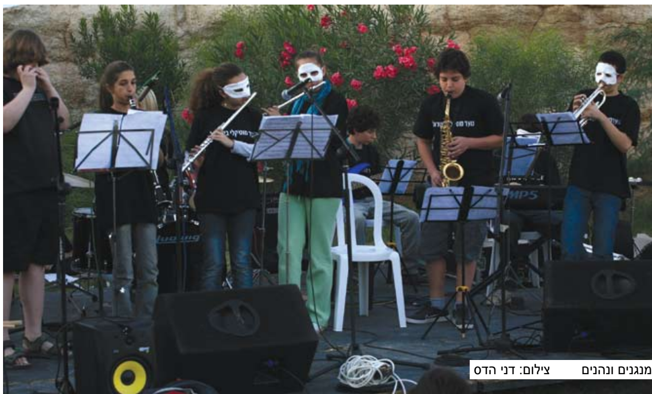
מנגנים ונהנים