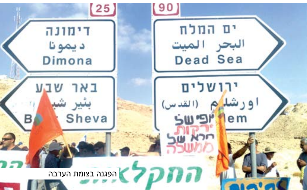
הפגנה בצומת הערבה

ארצית. לצערי הרוב לא נענה ולכן יצאנו למערכה לבד עם תמיכה מועטת יחסית ברמה הארצית. לשמחתי, גם אם באיחור מה, "נפל האסימון" והמאבק הפך לארצי. אנו מנסים לקדם שלוחה של משרד הפנים לטיפול בעובדים ובכך לחסוך את הנסיעות הארוכות תוך אובדן ימי עבודה רבים.