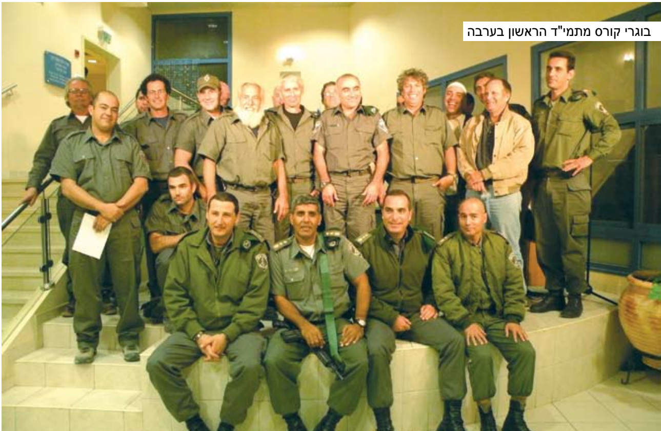
בוגרי קורס מתמי"ד הראשון בערבה

בהחלט לא מובן מאליו ומדובר בנתון מרשים ביותר.