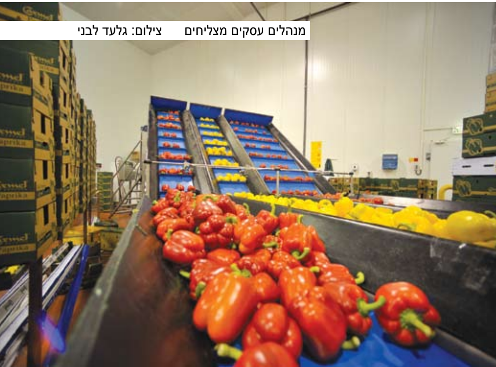
מנהלים עסקים מצליחים