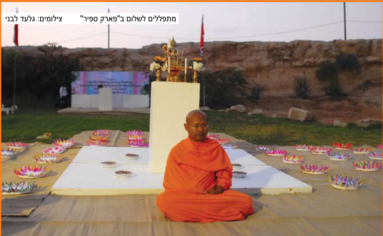
מתפללים לשלום ב"פארק ספיר"

ולהתפלל לשלום ואחוה. הטקס התקיים בו זמנית בירדן וברחבי העולם. הטקס נפתח בברכת הנזיר שהגיע במיוחד מאוסטרליה, ולאחריו התקיים טקס רוחני הכולל מדיטציה ותפילה ובסופו הופרחו לאוויר בלוני אש. אחת התפילות הוקדשה לגלעד שליט ובה בקשה לשחרורו. המשתלמים התאילנדים אף הכינו עבורו סירה מיוחדת ובה תמונתו והשיטו אותה במי האגם.