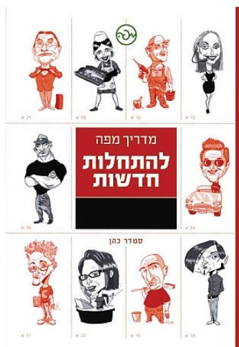
הביאה לדפוס: אוסי ניר

המדריך כולל עצות מעשיות בכל שלבי הקמת העסק הקטן כולל איסוף מידע ממקורות מידע שונים, קבלת מימון מתוכניות סיוע שונות ומקורות פיננסיים אחרים, תמחור המוצר או השרות, שיווק, פרסום ומכירות, פתיחת תיק במע"מ, ביטוח לאומי וברשות המס, כיצד להכניס שותף או בן משפחה לעסק ועוד.