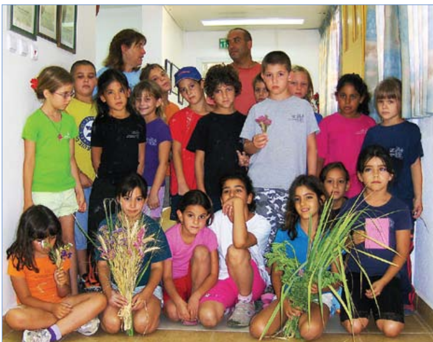
ילדי כיתה ב' מביאים ביכורים למועצה.

מענקי האיזון נקבעים לפי ההפרש בין ההוצאה הנדרשת לרשות כדי לספק לתושביה רשימת שירותים מינימאלית, לבין ההכנסה הפוטנציאלית שלה. הוצאות והכנסות אלו מחושבות על