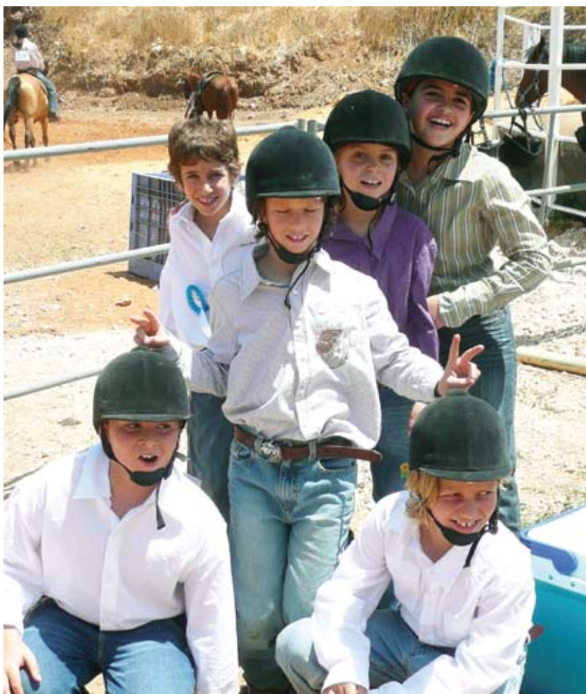
הנבחרת הצעירה של חוות צופר.

תחרות הסוסים ברכיבה מערבית התקיימה בסוף מאי וכינסה יותר מ-6 בתי ספר לרכיבה מרחבי הארץ לתחרויות אינטנסיביות. הרוכבים מחוות צופר - מכיתה א' (!) ועד המבוגרים הוכיחו שוב ושוב את שליטתם בסוסים ואת יכולותיהם המצוינות ברכיבה.