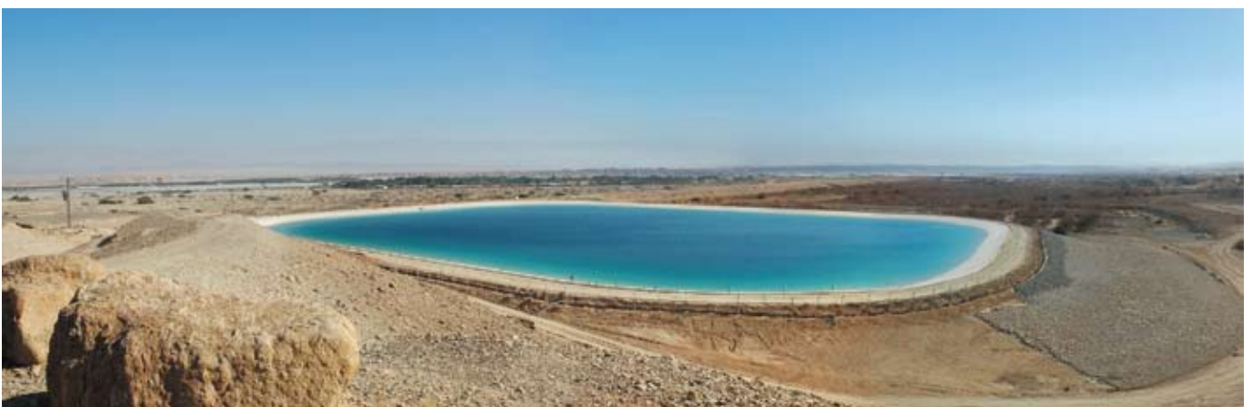
מאגר שיזף פתוח ומכוסה ביריעה.