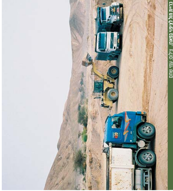
בית חול לציפוי בפינה

במקום נעשים ניסיונות לחיפוש אלטרנטיבות לאדמה החקלאית בשיתוף המני"פ והקולאים כמו מצעים מנותקים אולם התוערה בעייתית מיקון לנושא המיקון הדרוש למתיישבי ל-45 דונם הוא כ-600,000 כונת רישות מים. עד היום השיגו את המימון הדרוש להכשרה קונבנציונלית. נושא המימון הוא קרטי מכיוון שקור קיימת לישראל שמימנה במשך שנים רבות את הכשרת הקרקע, מממנת היום רק 50%, כלומר בין 2000-4000 ש"ח לדונם. המימון הנוסף לציפוי חול הוא כ-10,000 ש"ח לדונם ל-30 ס"מ גובה. חסוכות הקינור כבר זקוקים אינה משייכת, משךר החקלאית מתקשה בעניין ומשרד המשנה לראש התמטלה התחייב אך לא מממש כיום את נזמטת לשבור על מאוני הקרקע במושבים ועל שמירת הצדק באמצעי הצור וכן העברת חול משיבו אחד לשני ושמיירת הרדבות.