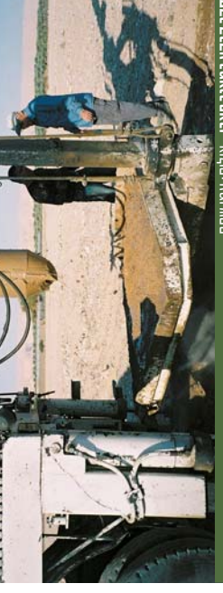
סוף קרקע במגרב פארן

לא ניתן להפריד את בעיית הקרקע מבעיית המים