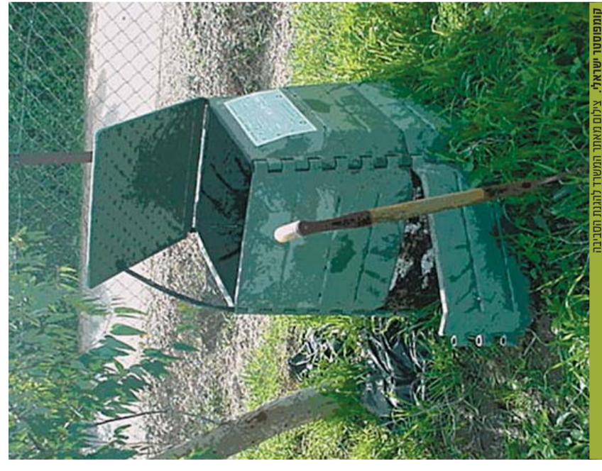
קומפוסטור ישראלי