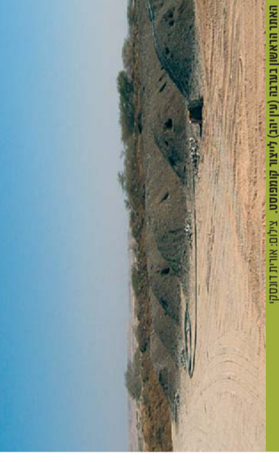
מחזור האורגנית בערבה (טון יוב) של קומפוסט

תור החיטוטות לאזור הקישור ההידרולוגיים, שמורות טבע, מרחק מישובים, גישה לצ'יר, תנועה קיבוצים ונחות תפעולית. האתר נבדק באופן עקרוני ודומות לצופר ומעבר לכיבש הערבה. קביעת המיקום המדויק תעשה בהתייחס למזים חוות הסוסים שמוקם בהימאם אלה. דרישות לאזור 5 שינוי פעולה עם קבלן ייצור קומפוסט. כונתנו ליצור שחופות ארבות טוחו בין האזור, באמצעות המיכה המשוללת, הרבנת התשתיות ובין קבלן הפעלת הפרויקט, החל משלב אספקת חומר צמחי אורגני קני באחרי המעבר ועד למכירת הקומפוסט לתקלאים. 6 פרש בעלי חיים. בהתאם לניסיון הרצטר, יוצר הקומפוסט יתקיים ביחס של 1:1 בין גזם צמחי קצוץ לבין פרש בעלי חיים. כיום, נראה כי קיים שדף של חומר צמחי שייחייב, "אכ"י, של פרש בעלי חיים לערבה ולא חיפוש אחרי פתרונות אחרים כמו ייצור אורגיה מהגזם הצמחי. יחד עם זאת, ראוי ליצור שבמדינת רבות בעולם קיימים מתקני קומפוסט עירוניים על בסיס פסולת אורגנית ביקת לבד (הפרדה במקור על ידי החושבים) ואין במתקנים אלה חוספת של פרש בעלי חיים, אלא רק שבני עצים להחפתת הרוח. הקומפוסט התקומי נקנה (באווה) על ידי המשבים. מה ענקיאי, הולאו עלנו.