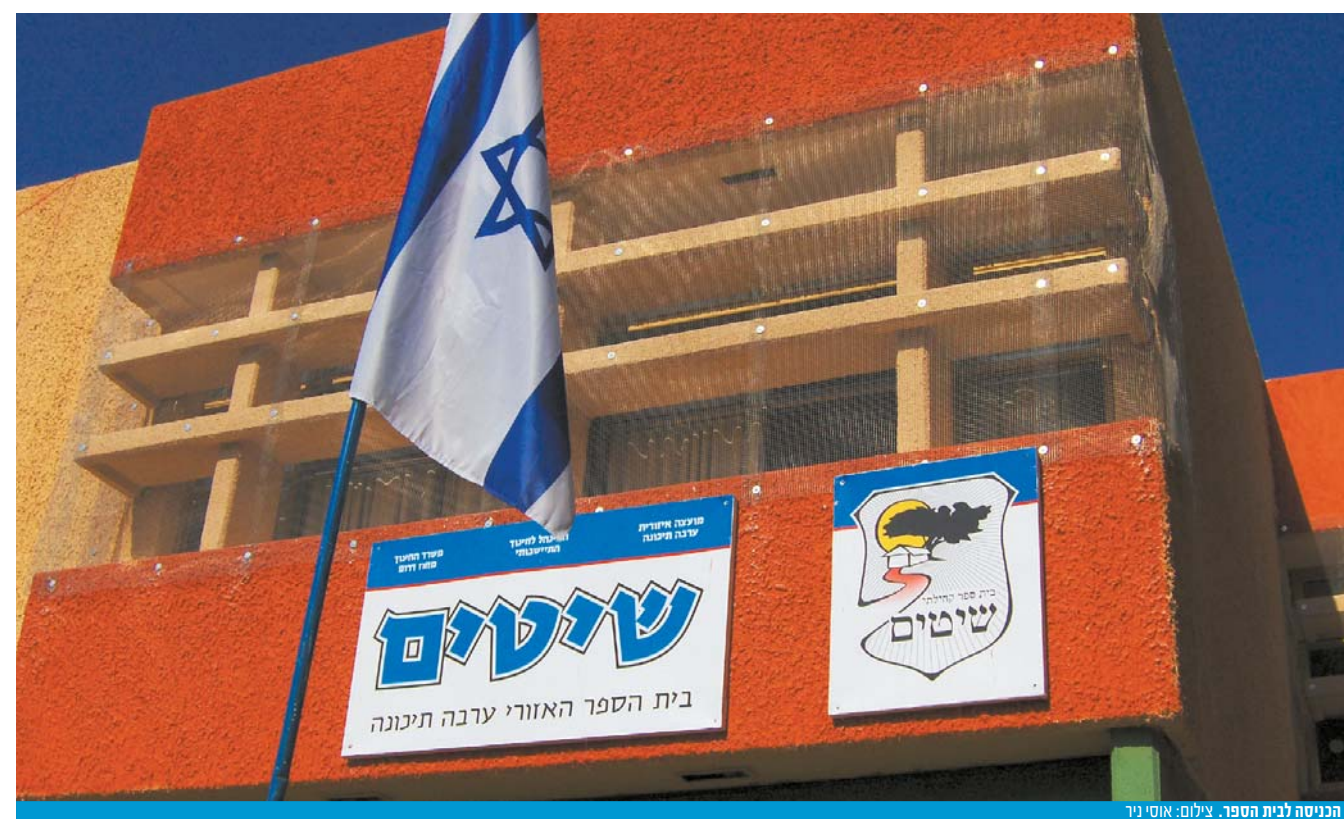
הכניסה לבית הספר.