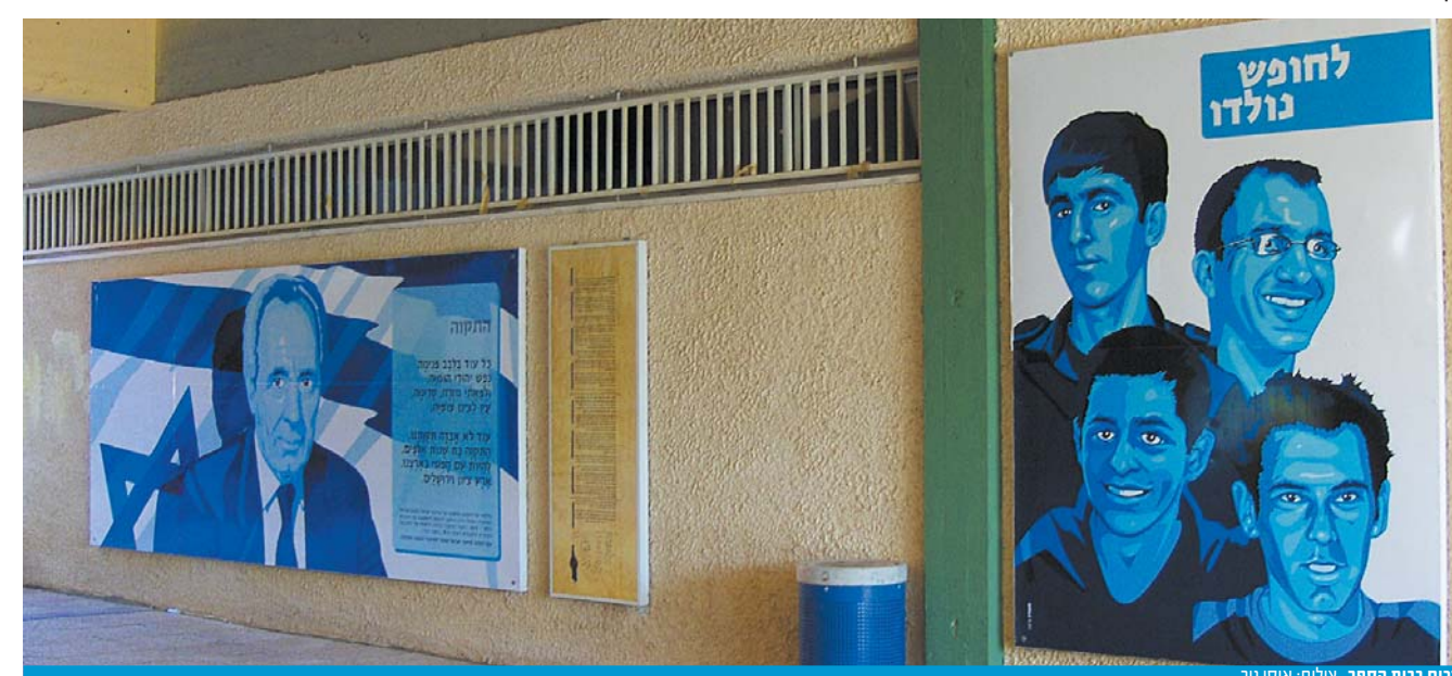
ערכים בבית הספר.

לסיכום, אני מזמינה הורים לפנות אלי בכל בעיה או שאלה. אני עומדת לרשותכם כל העת."