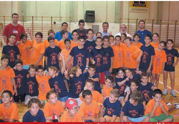
כדורסל ללא הפסקה, גילום באריכות מתנ"ס ערבה