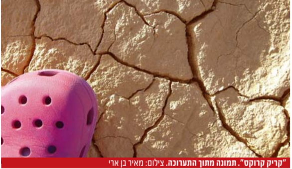
"קייק קרוקס", חתונת מוזקן הערבה, גילום: נמר בן ארי

הפעם, היחידה הסביבתית מציגה באולם רוזנטל את תערוכת התיכונה בנושא סביבה. בתערוכה מוצגים 28 צילומים יפהפיים המחמישים את הפנים הרבות לסביבה שלנו. פתיחת התערוכה התקיימה במדברנרוב המסורתי בספיר. מומלץ לבוא לראות!