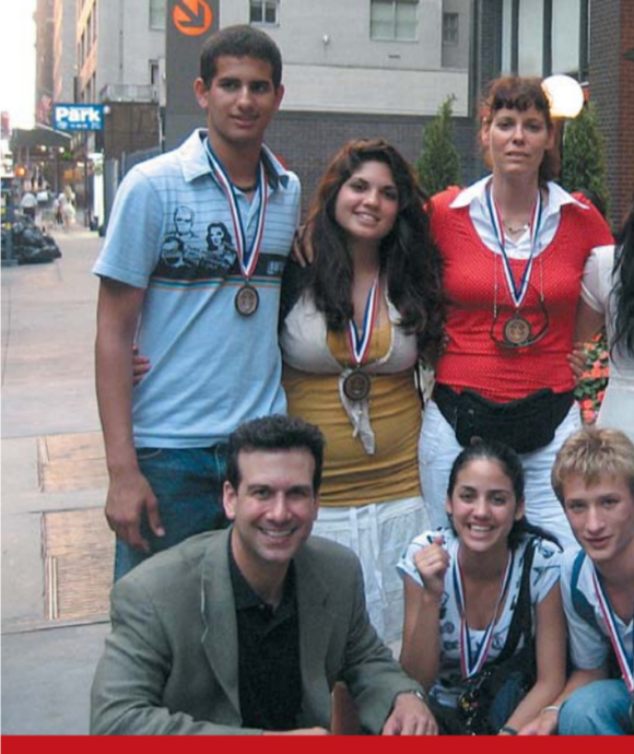
הישגים אחרון כהנוד, גילום באריכות תנרי והמשלחה

שישה מתלמידי מגמת חינוך גופני בתיכון נבחרו לייצג את ישראל ואת בית הספר בכנס באינדיאנפוליס בנושא מנהיגות ואזרחות טובה באמצעות ספורט