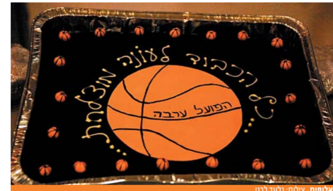
אליפים.