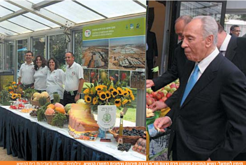
מיקיך לשמאל: נשיא המדינה שמעון פרס וצוות מו"פ ערבה תיכונה וצוותית במסכן הנשיא.

« צוות המו"פ מציג את מיטב התוצרת בבית הנשיא בירושלים באירוע חגיגי לשנה החדשה בנוכחות שגרירים ואח"מים נוספים