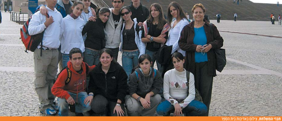
חזרי המשלחת.