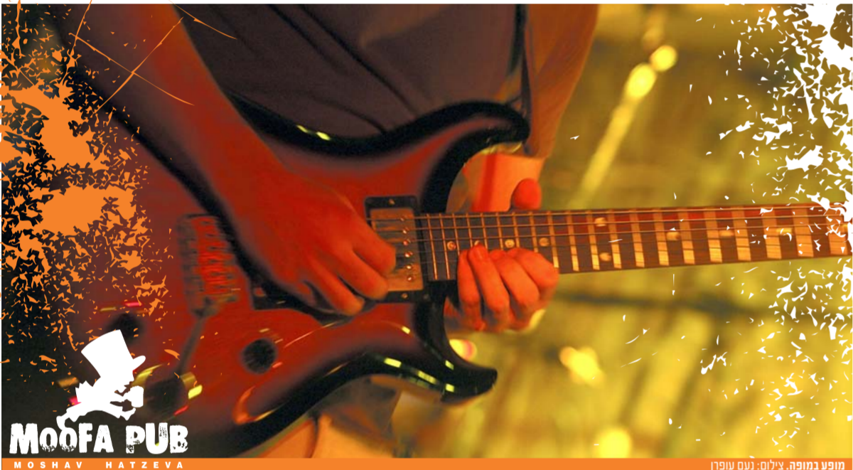
מופע במופה.