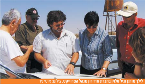
ליך מורגן נכר סליך בהתרום אחר דר מנחל הפרויקט.