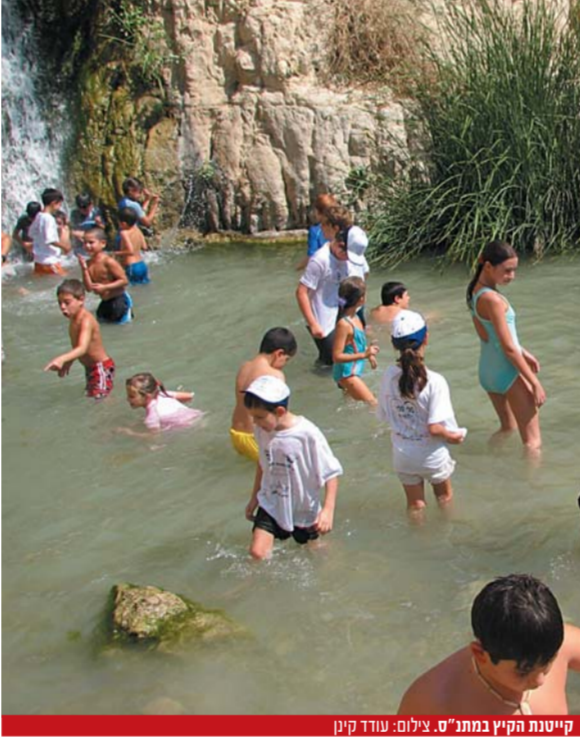
קיינות הקיץ במתנ"ס, גילום: עודד קקן