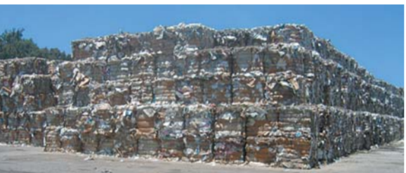
הר של נייר במפעל אמניר.

כמשך לביקור הגיעו נציגי אמניר לביקור בערבה במטרה לקדם הקמת מערך פינוי מסודר מכל ישוב שיהיה באחריותם. כרגע החברה מפנה מספיר כלבד ומחלקת התפעול במועצה דואגת לפינוי משאר הישבים. מערך הפינוי יכלול הצבת מיכלים גדולים לאיסוף החומר במרכז כל ישוב, במקום החביות המוצבות כיום. הסיבה היא שעל פי נתוני החברה במועצה שלנו כמות המיחזור לפש היא מהגבוהות ביותר בארץ. ולכל התושבים: על המטיבציה וההבנה של חשיבות השמירה על הסביבה - כל הכבוד!