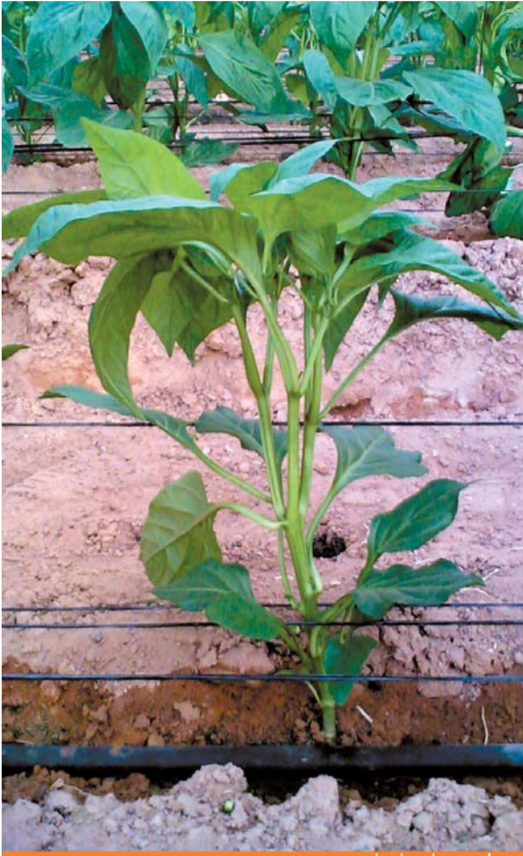
שיל צעיר.