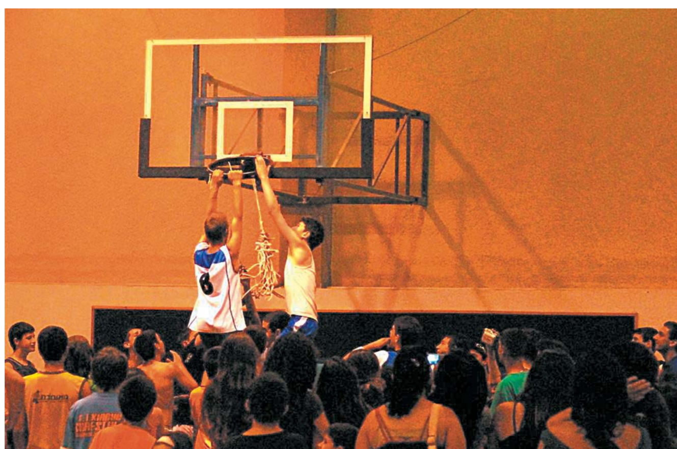
שנה מצוינת למחלקת הספורט.

המטרות שהציבה לעצמה לשנה הבאה: ביצוע תכנית הבראה עד להגעה לעצמאות ללא גירעון כספי ולאיוון תקציבי. להערכתה של נעמי התהליך יימשך 3-5 שנים. כצעד ראשון התקיימה במתנ"ס חשיבה מחודשת בנושא מחירי החוגים, והם אכן יועלו ב-5%.