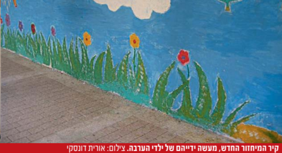
קיר המיחזור החדש, מעשה יריהם של ילדי הערבה, גילום: אורית דונסקי