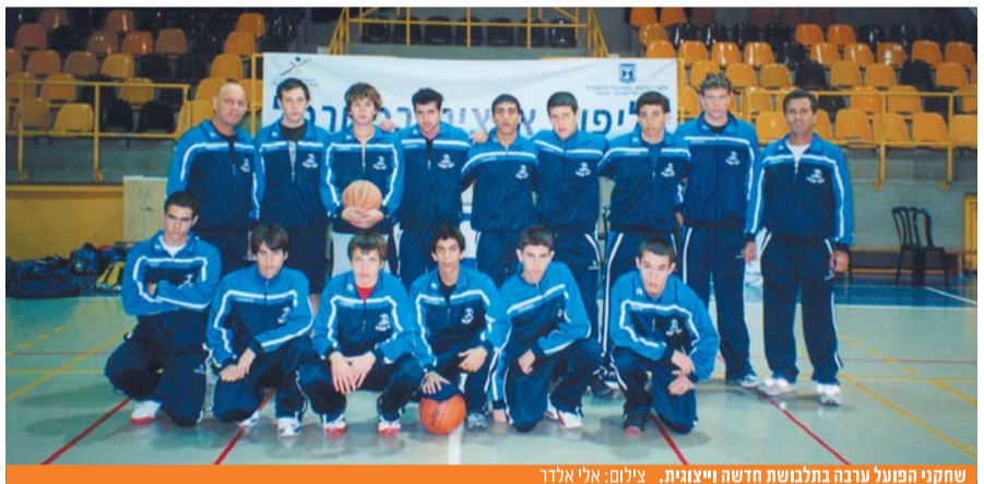
שחקני הפועל ערבה בתלבושת חדשה וייצוגית.

למרות העיכובים, הברכות ומשחק מצוין הפסידה קבוצת "הפועל" ערבה בשני המשחקים בגמר. המשחק נגד רמת השרון הוכרע רק בשניות הסיום כשהערבה שומטת את היתרון בו החזיקה לאורך כל המשחק. התוצאה בסיום: 64-62 לרמת השרון.