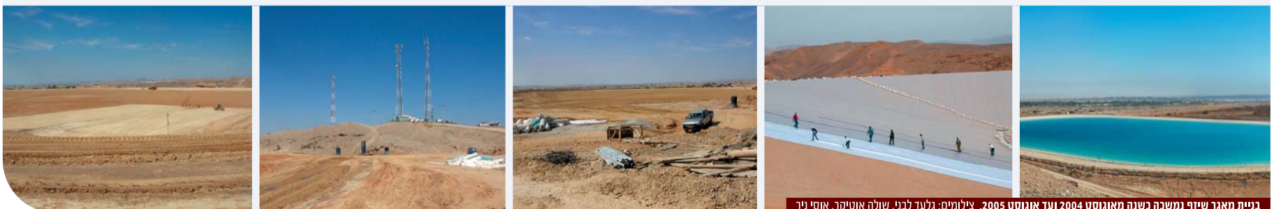
בניית מאגר שיזף נמשכה כשנה מאוגוסט 2004 ועד אוגוסט 2005.