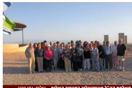
משלחת קק"ל מאוסטרליה במצפור השלום.

יודוביץ' וצוותה שביקרו בערבה ב-12/12/05 והתמקדו בעיקר בפרויקטים שנהנו מתמיכת מנהלת ההשקעות.