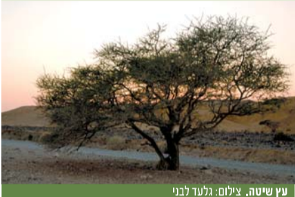
עץ שיטה.