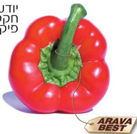
מתוך הדמנה לכנס בנושא המיתוג