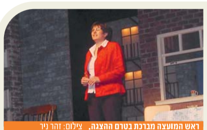
ראש המועצה מברכת בטרם ההצגה.