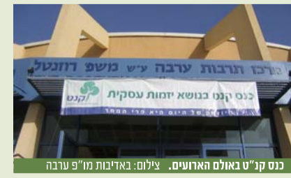
כנס קנ"ט באולם הארושים.