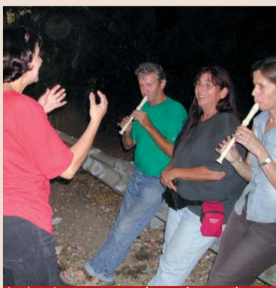
צמת הטל"ק ברגע של השארה ליד הרכב התקונן...

באופן כללי הכתבות הן אינפורמטיביות ומציגות את הנעשה בקהילה בדרך של סיפור מעניין, דרך עיניים אנושיות, או הצגת זווית שונה תוך שאיפה לאובייקטיביות ללא נקיטת עמדה. הם מציינים את השינוי שחל עם השנים אצל תושבי הערבה, שכבר רואים בטלוויזיה הקהילתית כלי חשוב ומשמעותי, ומודיעים לחברי הטל"ק על תופעות או פעילות מיוחדת שכדאי לסקר. כך לדוגמא, הזמן צוות הטל"ק לסקר את השכיחה בביה"ס היסודי. הם יודעים איך להשתמש בנו" מציינים אחד הפעילים. אולם, למרות הצורך המובן לסקר ברמה