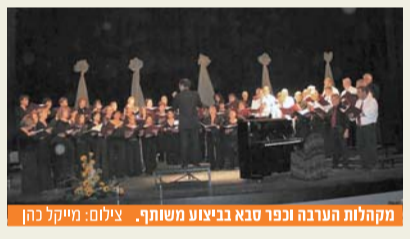
מקהלת ערבה וכפר סבא בניצוח משותף.