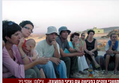
תושבי צוקים בפגישה עם נציגי המועצה.

בעידן נפגשנו ב-20/11/05 ושם התעניינו התושבים בנושא בניית התשתיות בהתאם לתב"ע החדשה, מדרכות, תחנות אוטובוס מסודרות, נושא