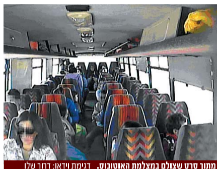
מתוך סרט שצולם במצלמת האוטובוס.