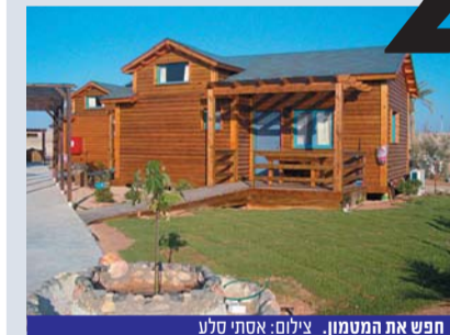
חפא את המטמון.

השבוע הושקו 5 בקתות עץ לאירוח ובכך מתחילה הערבה התיכונה את השנה כשמאחוריה כבר הצימר ה-200