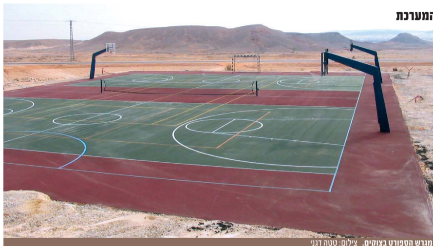
מגרש הספורט בצוקים.