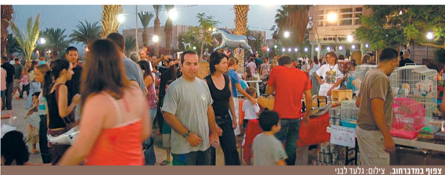
צפוף במדברחוב.