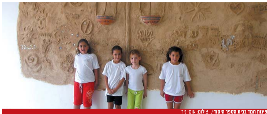
פינות חמד בבית הספר היסודי.