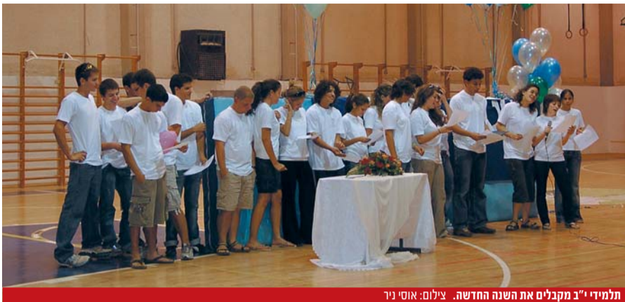
תלמידי י"ב מקבלים את השנה החדשה.