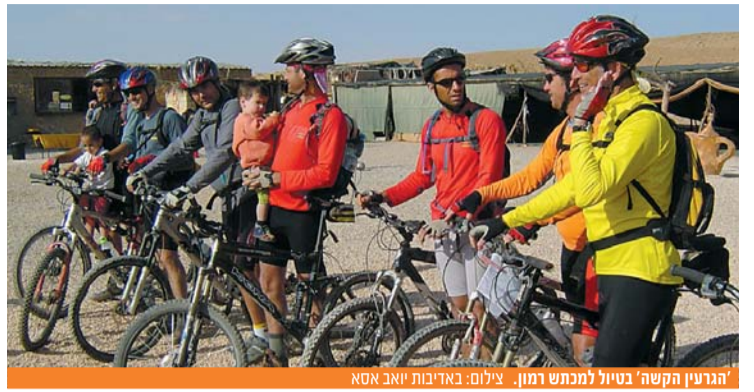
הגרעין הקשה' בטיול למכתש רמון.