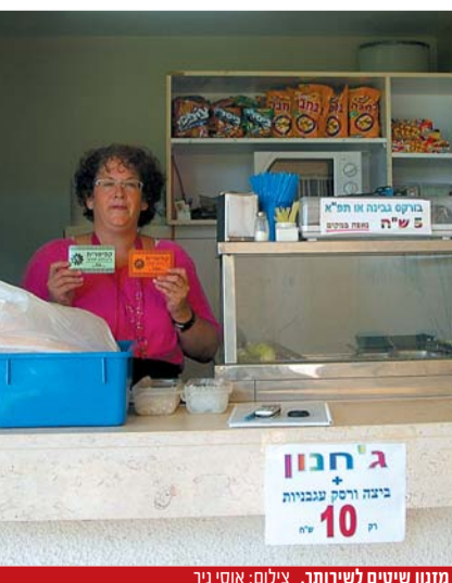
מזנון שיטים לשירותך.

קוסקוס, פיצה, מאפים טריים הנאפים במקום, ג'חנון ומרקים בחורף הם רק חלק מתפריט הפינוקים של קפיטריית התיכון