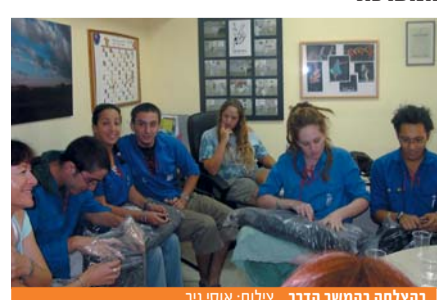
בהצלחה במשך הדרך.