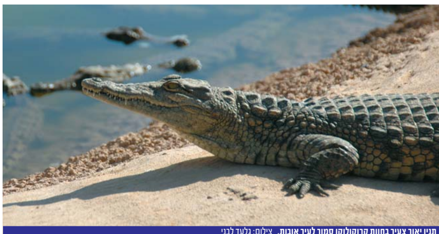
תנין יאור צעיר בחוות קרוקולוקו סמוך לעיר אובות.