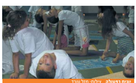
יוגים בפעולה.