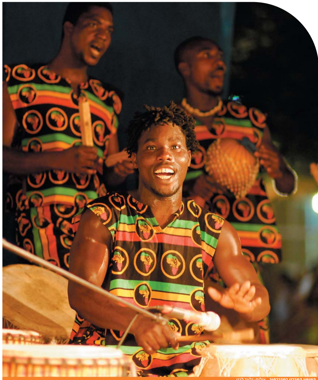
המופע המרכזי במדברחוב.

נפש. מפגשים מרתקים עם אנשים מעניינים המביאים לנו את ניחוחות התרבות המדהימה של ארצנו. כמוני שותפים לחוויה התרבותית הזו של תושבים רבים בערבה, המשתוקקים למגע התרבותי המהנה. מי ייתן ושנה חדשה זו תביא עימה מפגשי ספרות נוספים!