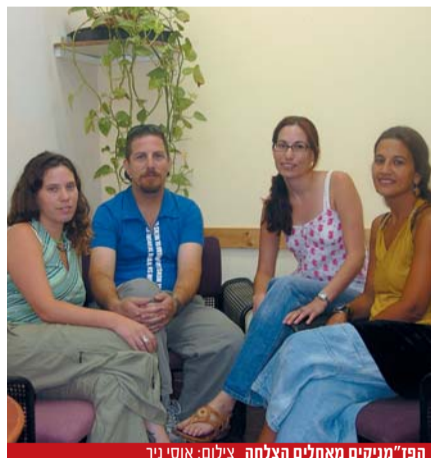
הפז"מניקים מאחלים הצלחה.