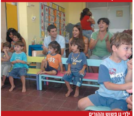
ילדי גן פשוש וההורים

השנה נפתחו שבעה גנים של משרד החינוך בהם לומדים 140 ילדים. קלטנו 4 גנות חדשות ולראשונה בערבה קלטנו עוזר גננת, מאיר בן ארי מצוקים בגן תמר בספיר (טרום חובה וחובה). 15 הפעוטונים נפתחו כסדרם עם 30 מטפלות מהן 16 ותיקות. במתנ"ס מתקיים קורס למטפלות בחסות משרד העבודה ומשתתפות בו 13 מטפלות. משרד החינוך פרסם לראשונה תכנית לימודים לחינוך הקדם יסודי והיא מחייבת את כל גני משרד החינוך בארץ. בכונתנו להרחיב את תכנית המדעים המוצלחת בהנחיית ד"ר מינה יורם ולהעמיק בתכנית "גן ירוק" עם אורית אביבי.