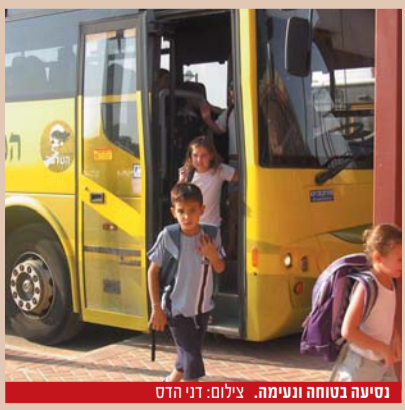
נסיעה בטוחה ונעימה.