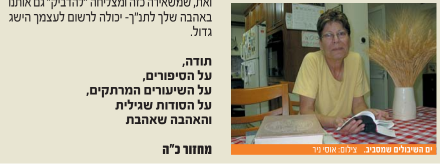
ים השיבולים שמתסביב.

כיווני מחקר ייחודיים בערבה יכולים להיות בנושאים כמו סביבה, צמחים, חיות, חקלאות מדברית שתגרה אותם למקומות ונושאים שבהם מערכת הלימודים לא נוגעת.