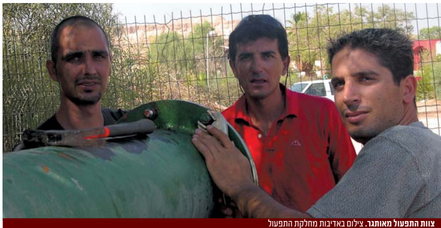
צוות התפעול מאתגר.

« הם עובדים בחוץ, רצים ממקום למקום, גם בשמש הרוותחת של יולי אוגוסט, העבודה לעולם אינה נגמרת והם תמיד עם חיוך על פניהם