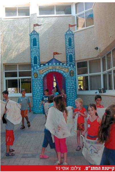
קייטנת המתנ"ס