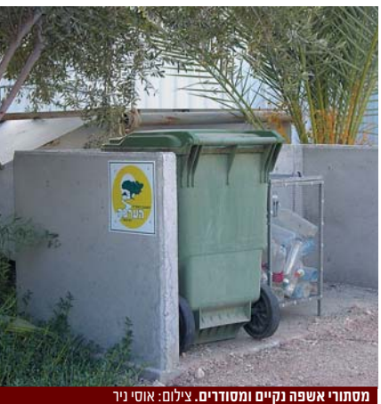
מסתורי אשפה נקיים ומסודרים.

חשיבות נוספת היא התרומה לאיכות הסביבה, כאשר למסתורי האשפה נוספים מיכלי איסוף לבקבוקי פלסטיק וריקים ומיכלים לאיסוף בטריות משומשות. המועצה האזורית מספקת פח אשפה אחד לכל משפחה. קיימת אפשרות לרכישת פח נוסף בעלות של 300 ₪ והחלפת פח ישן בחדש בעלות של 200₪ (מפורט בחוברת סל השירותים ובאתר האינטרנט).