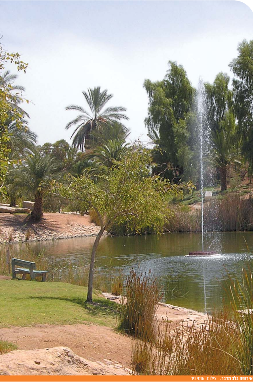
אירופה בלב מדבר.