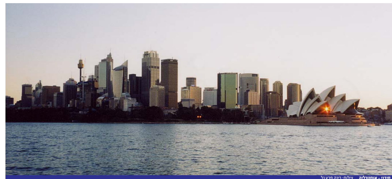
סידני - אוסטרליה.

רינה פרץ גל מנהלת שותפות 2000 ערבה אוסטרליה