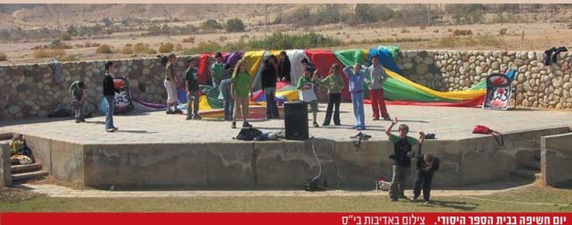
יום חשיפה בבית הספר היסודי