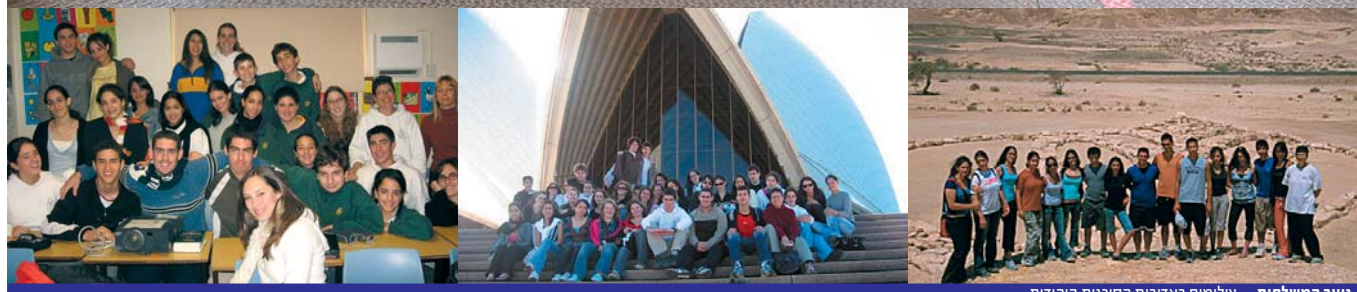
נוער המשלחות.